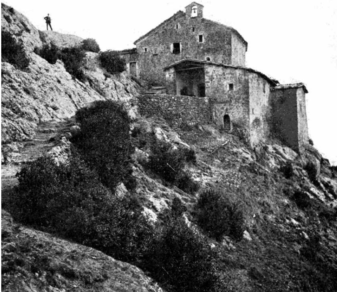
Els Tossals.

En l'Acta de Visites Pastorals del Cint de l'any 1745, el visitador constata que l'església està en un estat de deixadesa tal que no permet de celebrar-hi la missa. Per això mana als obrers que, dintre tres mesos, netegin l'església i col·loquin les campanes al campanar.