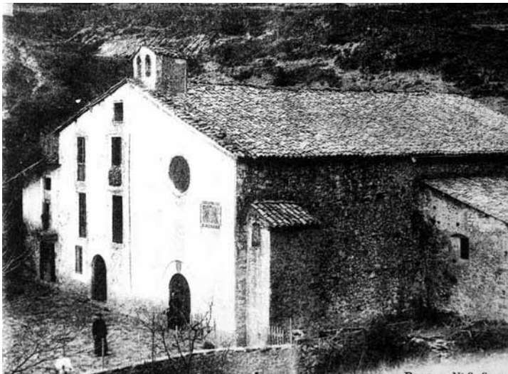
Santuari de Paller. ARXIU ARB

XIX. El de l'altar major era de fusta menys les columnes que eren de guix.