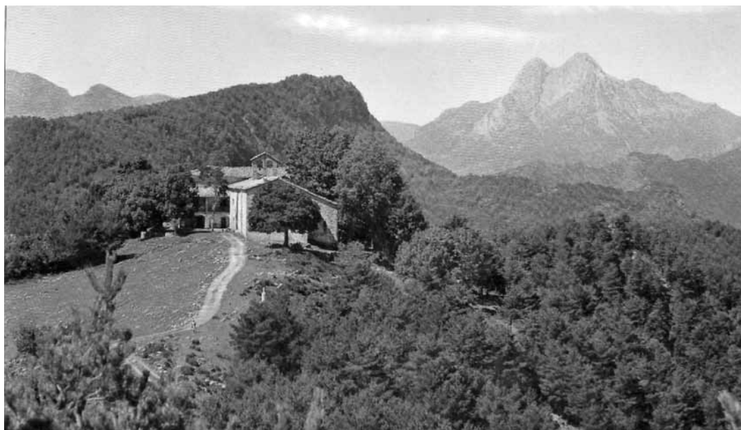
Santuari de Falgars.

L'edifici fou construït entre 1677 i 1682, sota la direcció del mestre de cases, Gaspar Brija, gavatx. El 1684 se celebrà la festa d'inauguració i benedicció i s'hi portà la imatge de la capella antiga.