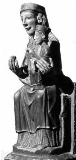
Mare de Déu dels Torrents.

Del Berguedà estudia o presenta com a santuaris: la Mare de Déu de Corbera, d'Espinalbet (Castellar del Riu), la Mare de Déu de Falgars, de la Pobla de Lillet, la Mare de Déu del Gresolet, Gresolet (Saldes), la Mare de Déu de la Quar, de la Quar, la Mare de Déu dels Torrents, del Cint (Espunyola), la Mare de Déu dels Tosals, de Capolat, la Mare de Déu de Queralt de la Valltan, la Mare de Déu de l'Hospitalet o Rocasaça, de Gréixer (Guardiola de Berguedà) i la Mare de Déu de Coaner, de Coaner (Sant Mateu de Bages)