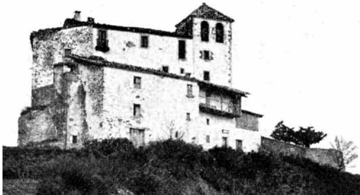
La Quar. ARXIU ARB

de 1790 s'inaugurava i es beneïa solemnement el nou santuari, amb la seva hostatgeria al costat, i rectoria.