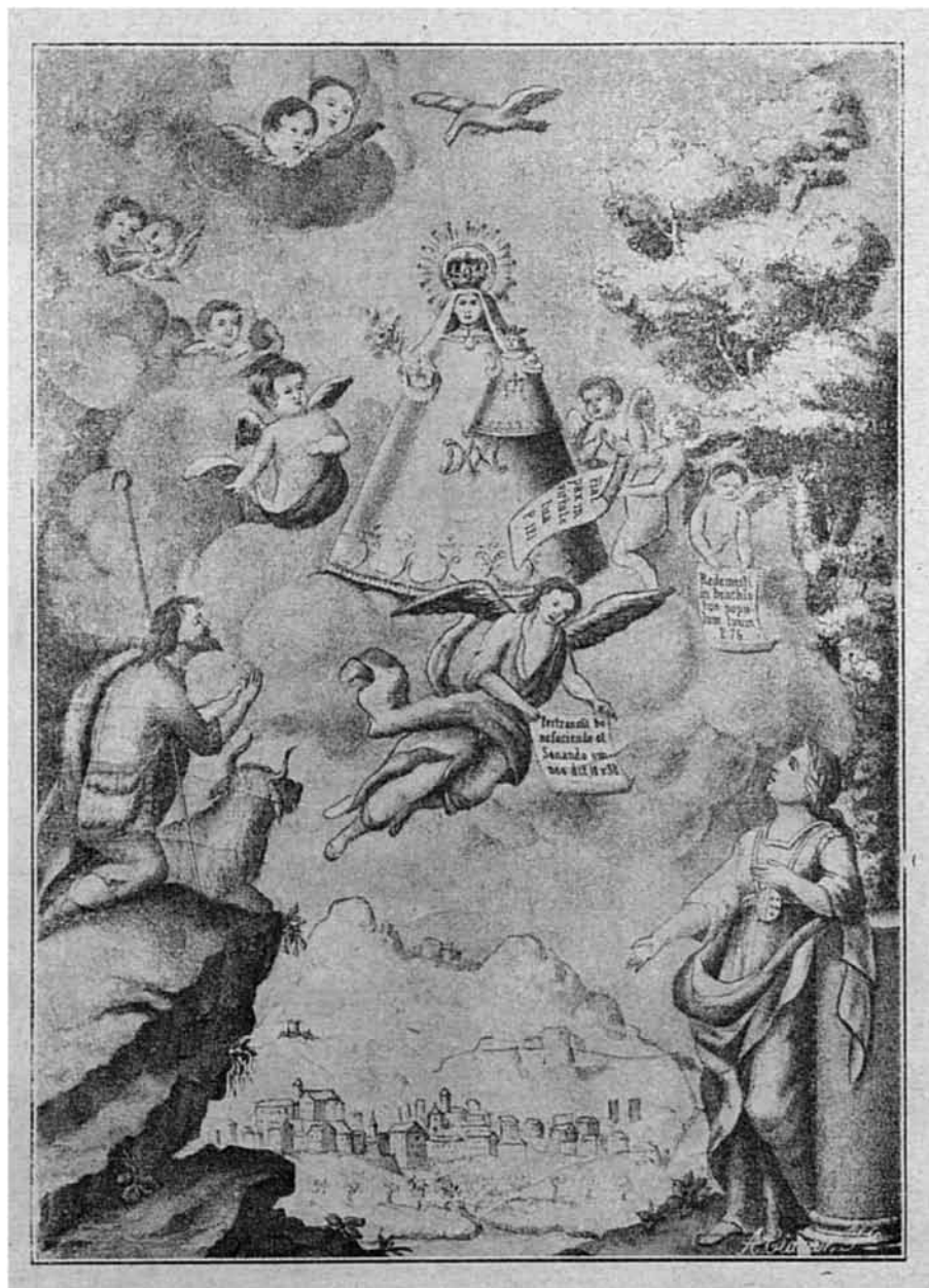
Fig. 6 Nuestra Señora de Queralt. Primera meitat del segle XIX. PROPIETAT DE LLUIS BUSQUETS