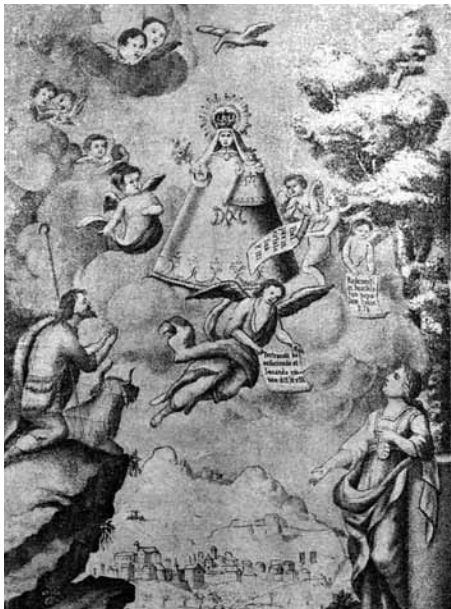
Fig. 3 Nuestra Señora de Queralt en una reedicció de 1853 "a expensas" d'Antoni Busquet.