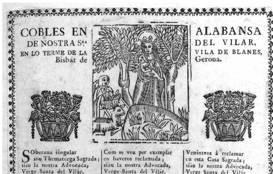
Fig. 2 Coples en Alabansa de la Nostra Senyora del Vilar. FRANCISCO SURIÁ Y BRUGADA. BNC