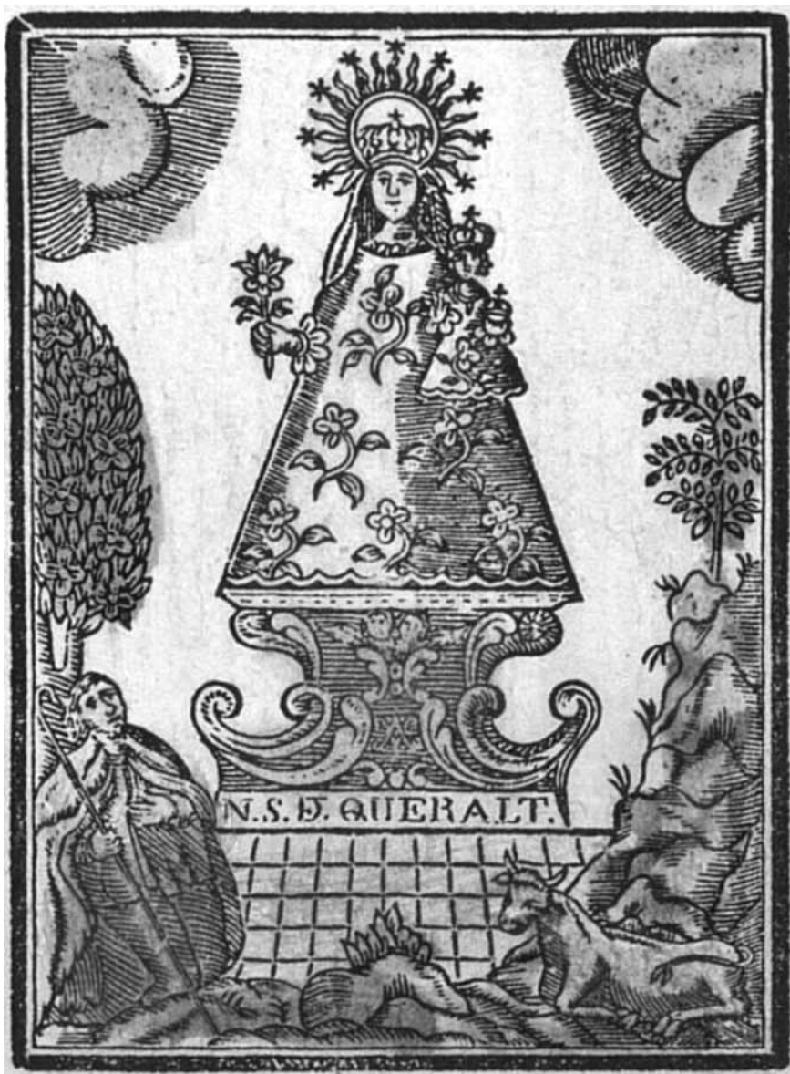
Fig. 4. Aquesta tipologia es repeteix durant tot el segle XIX en diverses variants. La primera, com expliquem al text, data del 1812.

gades, datada del 1812 i patrocinada per la Junta Superior del Principat (fig. 4), a mans carlines. Aquí s'opta per representar la talla vestida amb el bou i el pastor de la llegenda que amb lleugeres variants s'anirà perpetuant fins el segle XX.