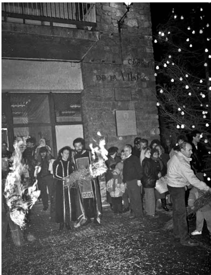
Faia llarga, presentada a l'època del concurs. AUTOR: FRANCESC CABALLÉ