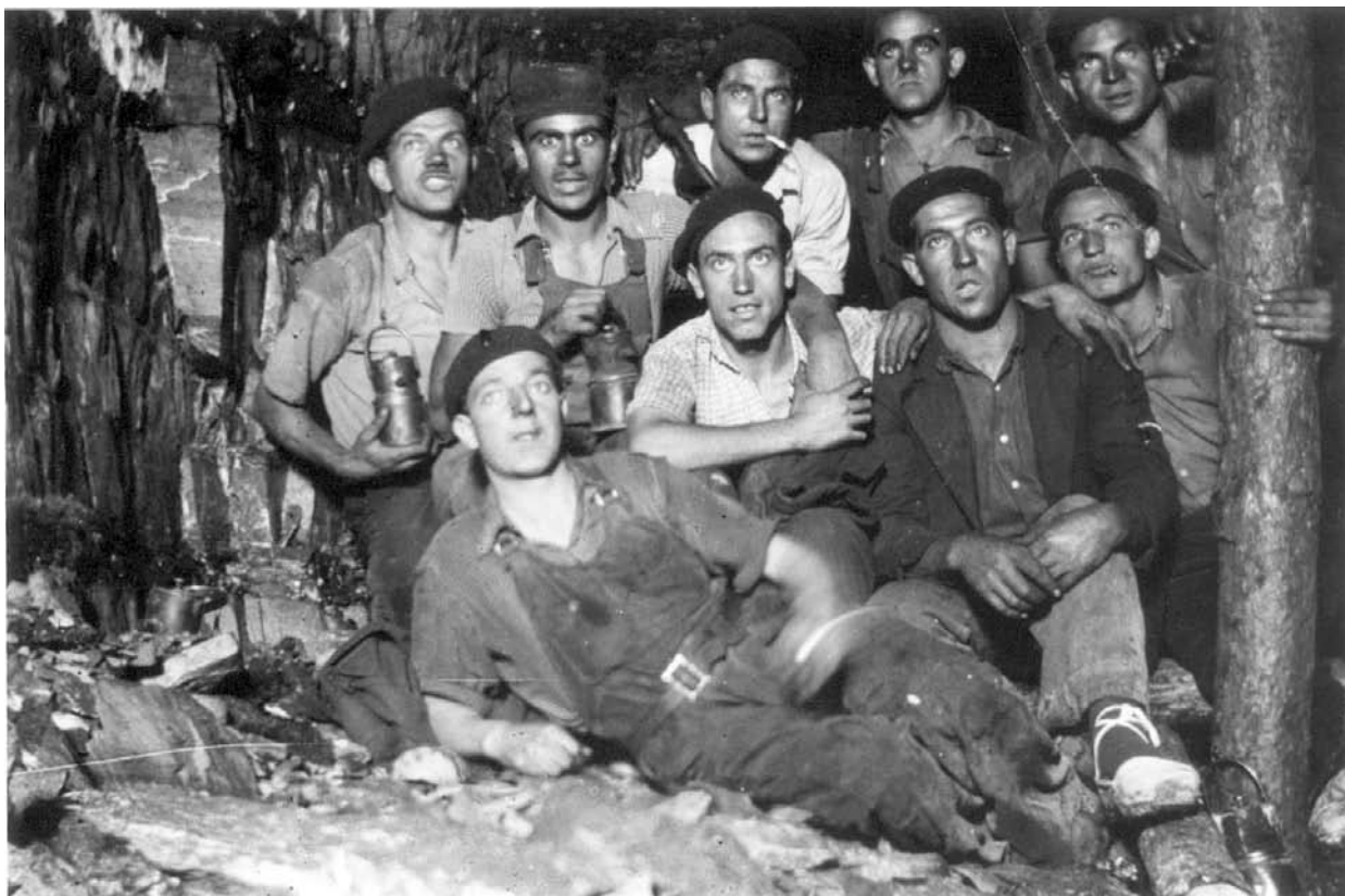
Miners a l'interior de la Consolació o Mina nova