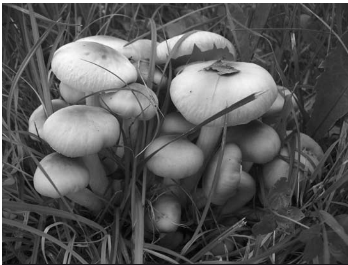
Peu de foto: Pollancrons del juliol.

15 de juliol. Hi ha qui diu que els bolets de soca tots són bons però jo només en conec d'una mena. El divendres passat en vaig collir al peu del Pedraforca. L'endemà, dia 11, va complir setanta-cinc anys el bisbe de Solsona, l'edat que marca el cànon 401 § 1