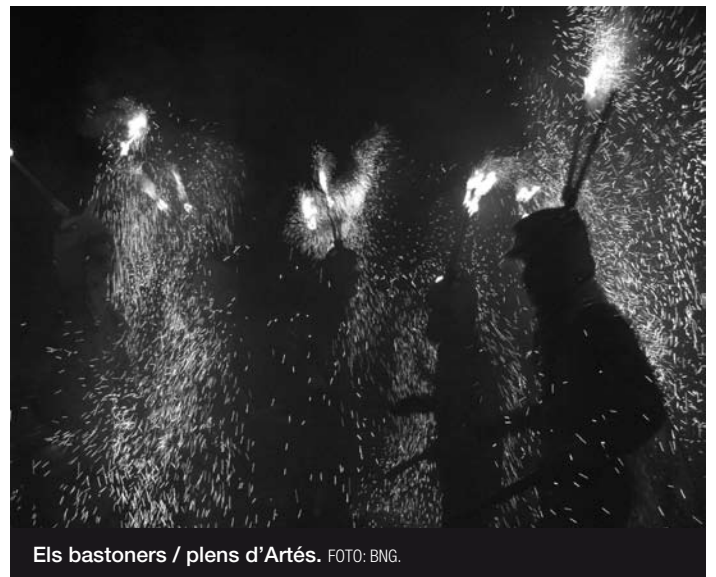
Els bastoners / plens d'Artés.

24 de juny. El diumenge de Corpus vam ser a Solsona. A la plaça, els entremesos ballaven en un ambient solemne, distingit, d'aràica actualitat i casolà. Cap empenta: els infants fent rotilana