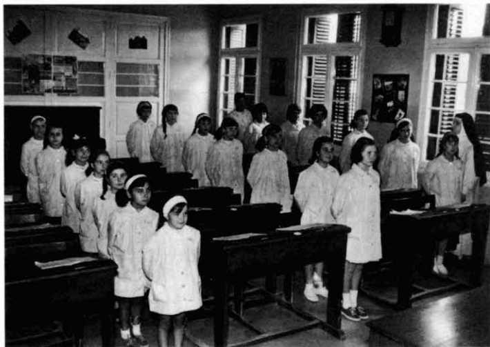
Alumnes de l'escola de nenes de la colònia Vidal a finals dels anys cinquanta del s. XX.

cions ambientals de treball dels obrers de la colònia.