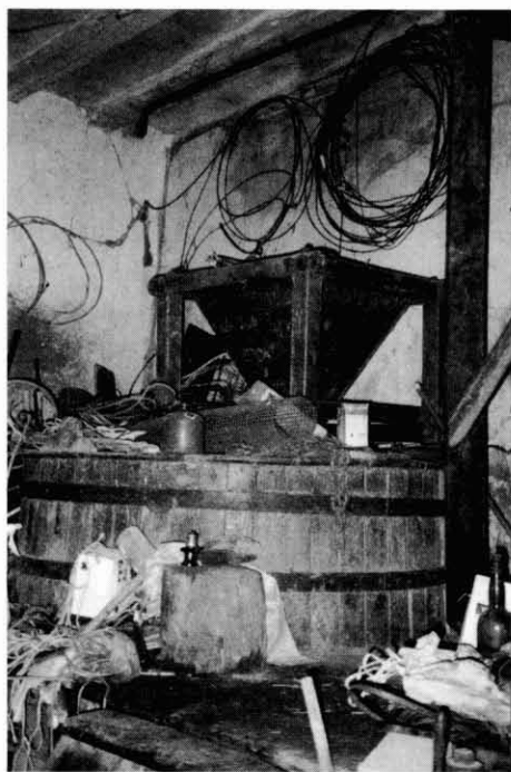
Molí de les Flors. GENER AYMAMI

Tanmateix es pot veure el dipòsit on es col·locava el gra per tal de ser netejat abans