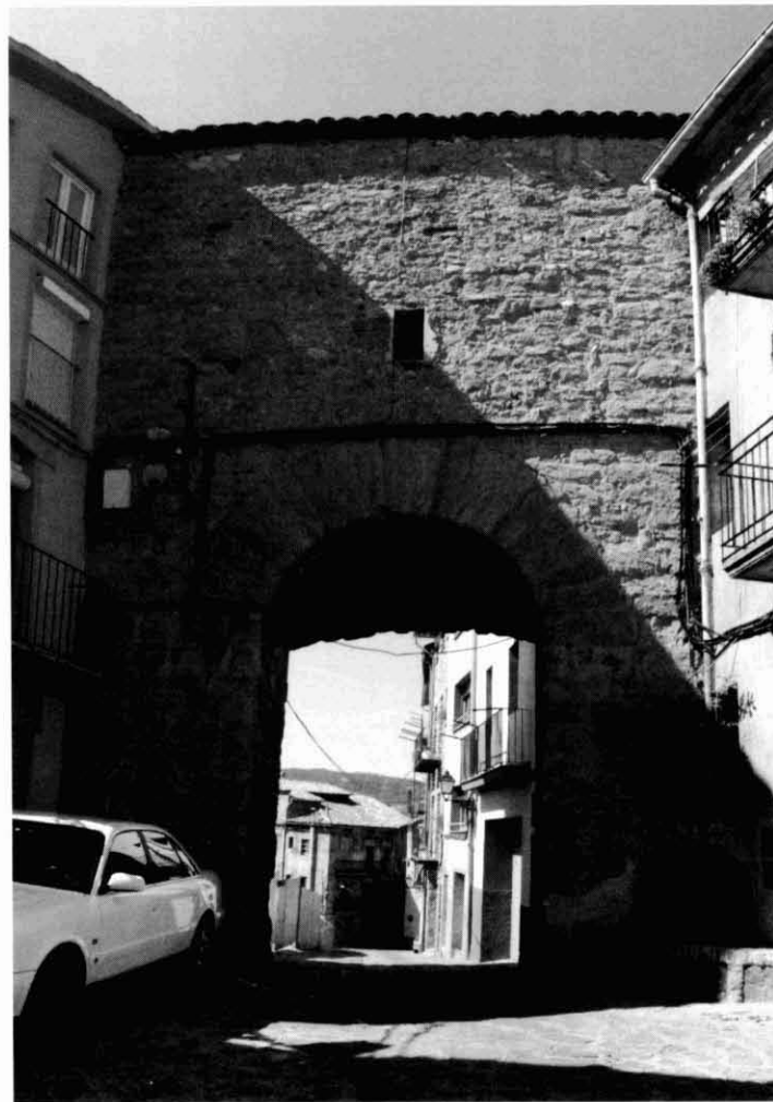
Portal de santa Magdalena. Lloc on s'iniciaven els camins que unien Berga amb Bagà, Puigcerdà i Ripoll.

Per arribar al mas Bergafeta hi havia un camí que passava prop del que actualment es coneix com el Parany, antigament anomenat Fossar dels Jueus, notícia que trobem recollida en les Efemérides Bergadanas (38). El document que ens permet conèixer aquest camí data del 18 de desembre de 1435 i és l'inventari dels béns de Joan Noguera. Entre aquests, hi figura una vinya, anomenada del Colomer, situada prop del Fossar dels Jueus i que té, com una de les seves afrontacions, el camí que va a Bergafeta (39). També a l'oest, però més a tocar de la vila de Berga, hi havia els llocs anomenats de Treconelles i Pedregals, tots dos pertanyents a la parròquia de Sant Pere de Madrona. El primer dels topònims s'ha perdut