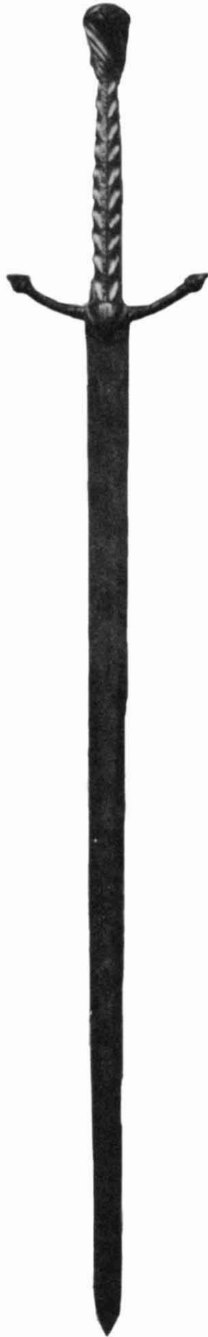
Espasa de Pere IV.