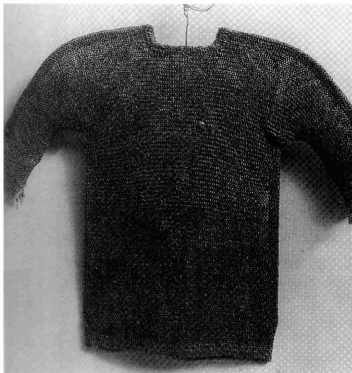
Cota de malla.

iem que ha de tractar-se d'un tipus de projectil de ballesa.