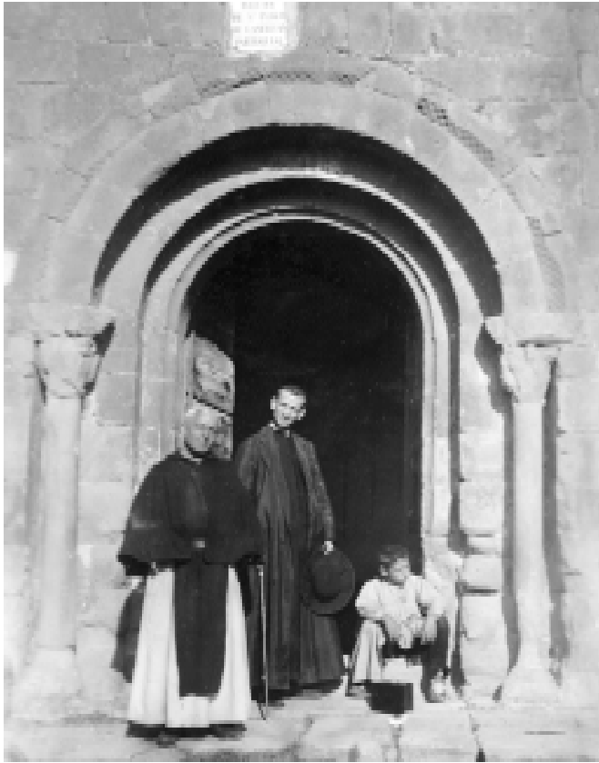
Portalada de l'església de Sant Pau de Casserres MN. JOAN SERRA VILARÓ. ARXIU MN. ÀNGEL PLA I TOMÀS