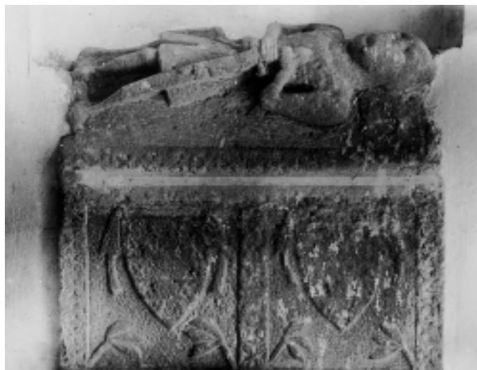
Sarcòfags de l'església de Casserres.