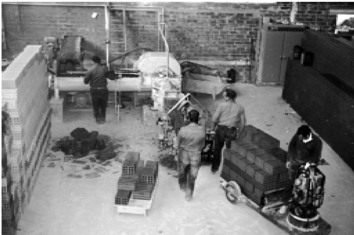
Interior de la bòbila on es veu el procés de la fabricació de totxanes.

que hi havia. En aquesta teuleria hi treballaven de 8 a 10 persones.