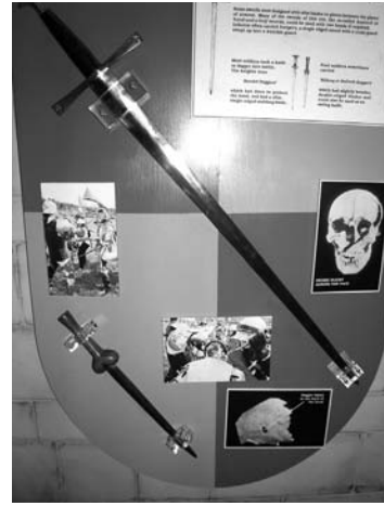
Centre d'interpretació del camp de batalla de Bosworth, Anglaterra.