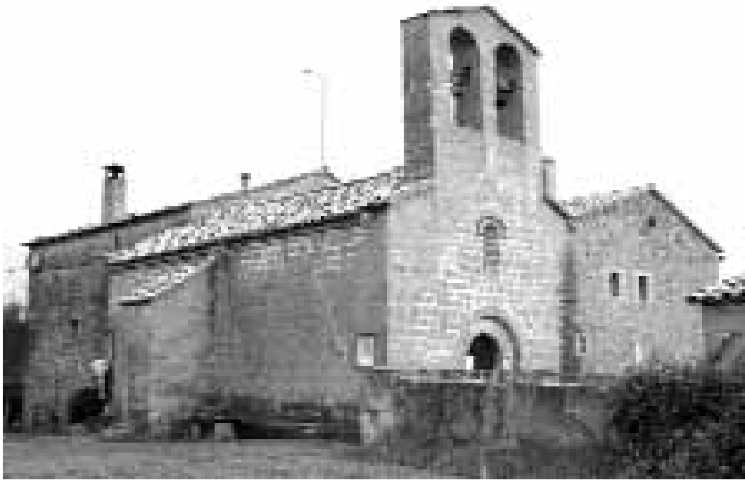
Església de Fonollet amb la casa de cal Fuster i la rectoria.

grada i Religió. Procuero fer-ho tan amè com m'és possible per mitjà de concursos i premiant els campions; les vetllades catequètiques donen un resultat excel·lent.