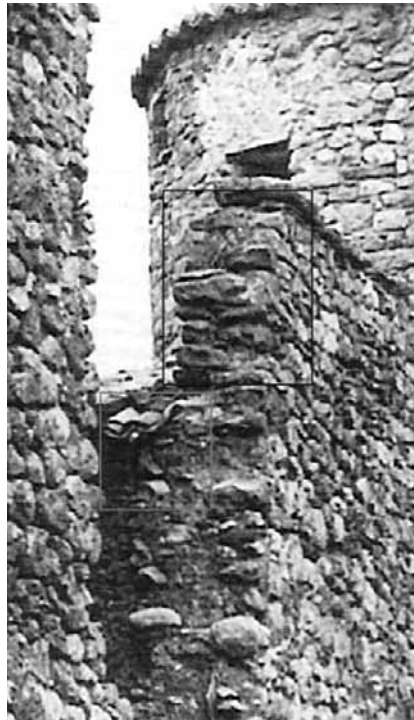
Fotografia d'arxiu amb una de les torres de l'antiga muralla de Bagà, concretament del portal de la Portella, al costat de la plaça porxada.

Dintre del contingut del treball trobem, un resum sobre les etapes de construcció de l'església, el perquè fou construïda en l'emplaçament actual (havent d'enderrocar cases relativament noves en el temps en que es plantejà la construcció del temple), i no al lloc que avui dia es coneix com els horts de Palau, emplaçament que no ha estat mai edificat, situat al nord de la vila i al costat de l'edifici de Palau; és d'estranyar, perquè a les baronies de Pinós, normalment, els edificis religiosos es situaven al costat de l'edifici de les estances dels senyors, com es pot veure en el cas de Guimerà, poble que també va pertànyer als barons de Pinós i que té una clara semblança en totes les característiques, a Bagà, excepte en la situació de l'església, això fa creure que l'única raó per a no construir l'edifici religiós allí és que a la zona dels horts de Palau de Bagà hi travessava pel bell mig una