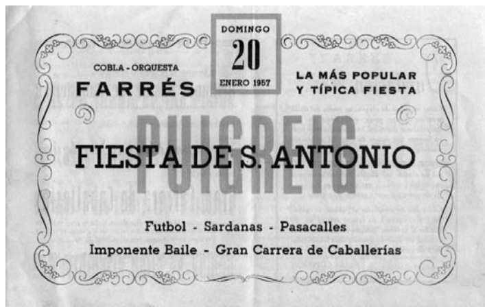
Puig-reig. Programa de la festa de Sant Antoni, "La Corrida", de l'any 1957, i una imatge del passacarrers.

devenir animals insubstituïbles. L'ase es va convertir en un animal clau per a la pagesia; es va fer servir per al transport, per a fer llargs viatges, per fer girar les rodes dels molins i els mecanismes de les sínies, per tragar les portadores de la verema, –"somadas" de vi és el nom amb què es coneix el cens que es pagava amb aquest producte–, per al transport de llenya i de farina, i el mitjà de transport per a mercaders i comerciants.