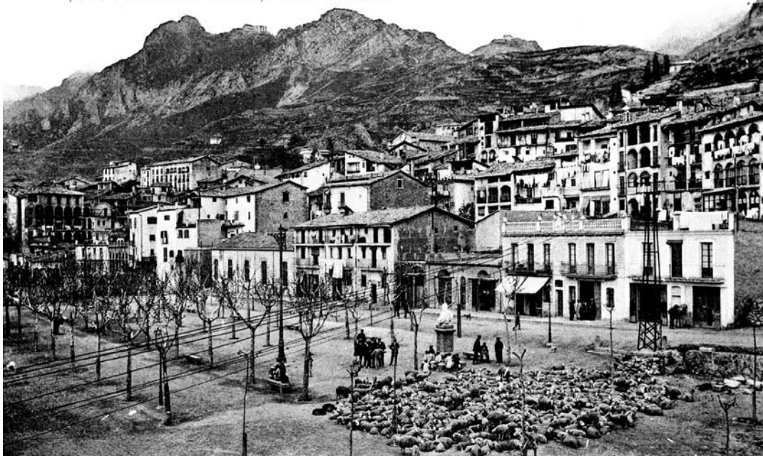
Pl. T. V. — 4452 - BERGA, Plassa Viladomat

L'escassetat i l'alt preu del cavall s'explica perquè a la Catalunya medieval l'ase i la somera van es-