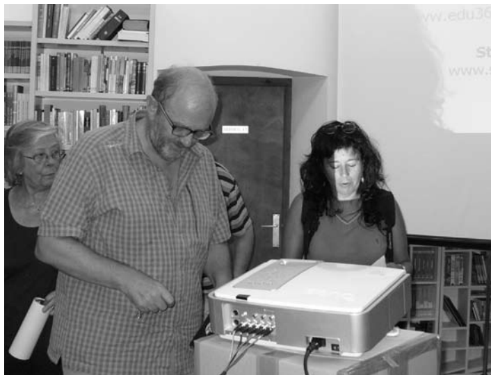
De Semir parlant d'estels a S. Jaume de Frontanyà.