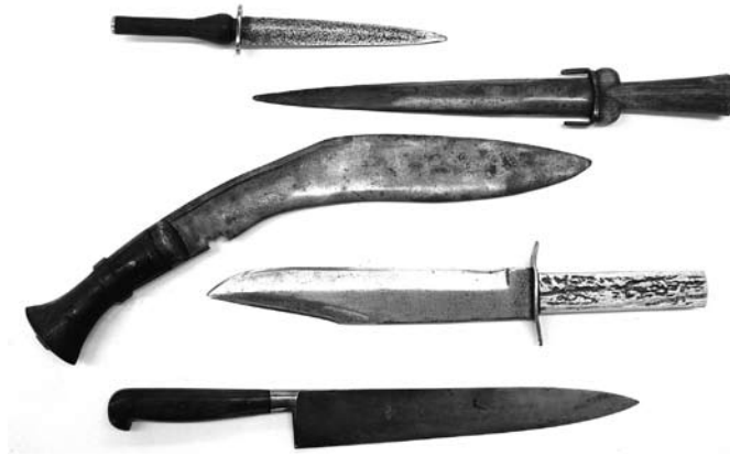
Mostra de diferents ganivets de l'exèrcit napoleònic

El factor polític va ser importantíssim i al respecte cal tenir present que els francesos van donar, formalment, la independència a Catalunya i després la van annexionar a França. Per tant va haver una corrent política francesa filo-catalana que ja havia tingut precedents molt directes quan el general Dagobert, durant la Guerra Gran, havia considerat la possibilitat de col·locar Catalu-