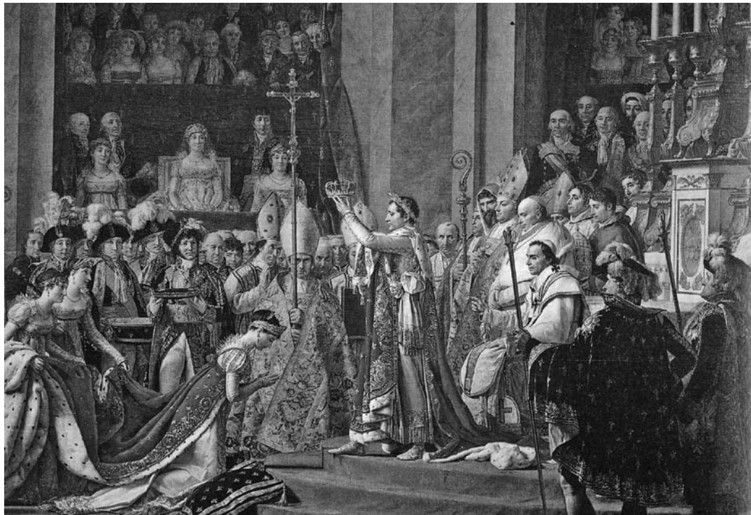
Coronació de Napoleó

Els últims estudis sobre el conflicte, tant a Catalunya com a Espanya, mostren que la Guerra fou molt més que un conflicte contra l'invasor i que una guerra de resistència. Bona part dels aldarulls que es van produir durant els primers mesos de la guerra tenen també un clar contingut revolucionari contra l'Antic Règim; aquest és el sentit, per exemple, de la revolta del 1808 que fou una revolta contra els francesos i contra Godoy i els seus partidaris que es va convertir