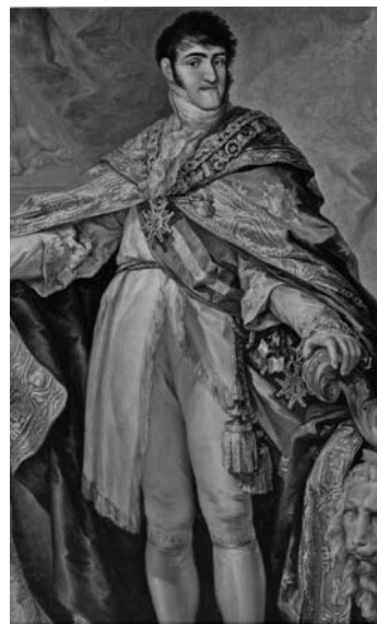
Ferran VII, una vegada més una obra mestra del pintor Goya

pocs moments de treva local. Serà un tenaç 'defensor' de la terra, però no acceptarà de convertir-se en soldat d'un exèrcit regular".