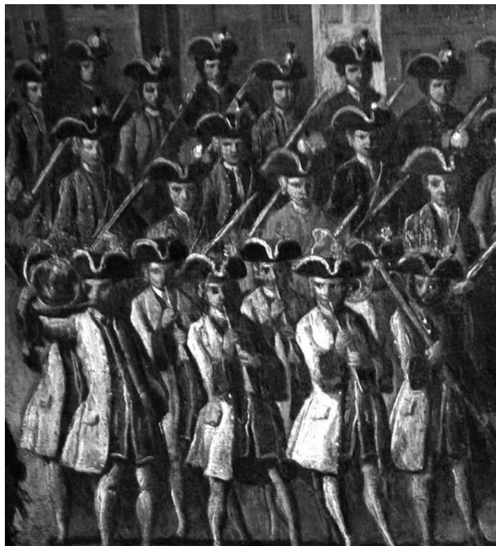
Fragment d'una pintura del s. XVIII amb la imatge dels Miquelets

Tots aquests sistemes de propaganda aconseguiren fixar una imatge de Napoleó amb uns trets molt clars: un home superb, insolent, desvergonyit, traïdor, mentider, indigne, blasfem, ambició, heretge i dolent; a més era qualificat com un personatge de trets ferotges i degradants i blasmat amb una llarga llista d'insults i burles de tot tipus. Per contra, la figura de Ferran VII omplí els carrers i les cases dels espanyols, molt especialment a partir de