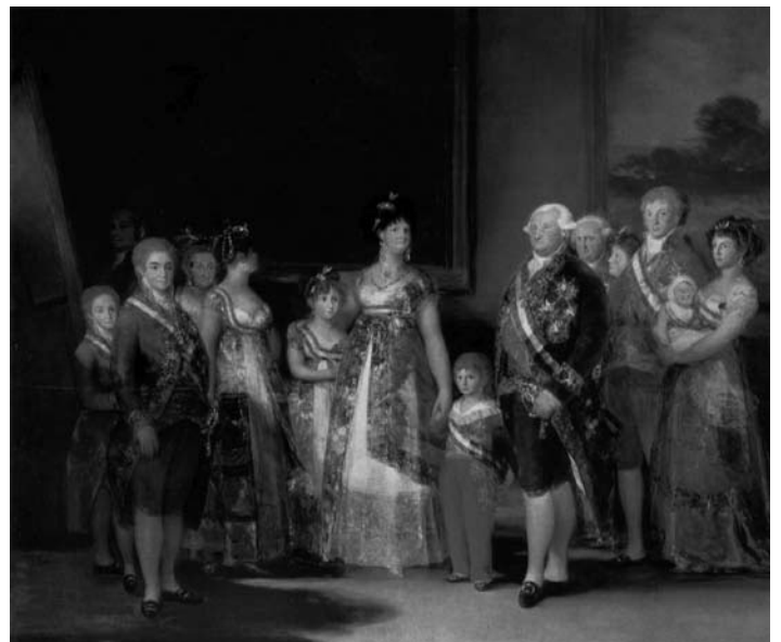
La família de Carles IV, una de les creacions pictòriques més importants de Goya i testimoni històric, pel valor del retrat psicològic, de la pintura del s. XIX.

Aquesta obra mestra de la pintura universal, un oli sobre tela de 280 x 336 cm fou la primera obra de Goya que va entrar a formar part de la col·lecció del Museu del Prado, on encara es pot admirar.