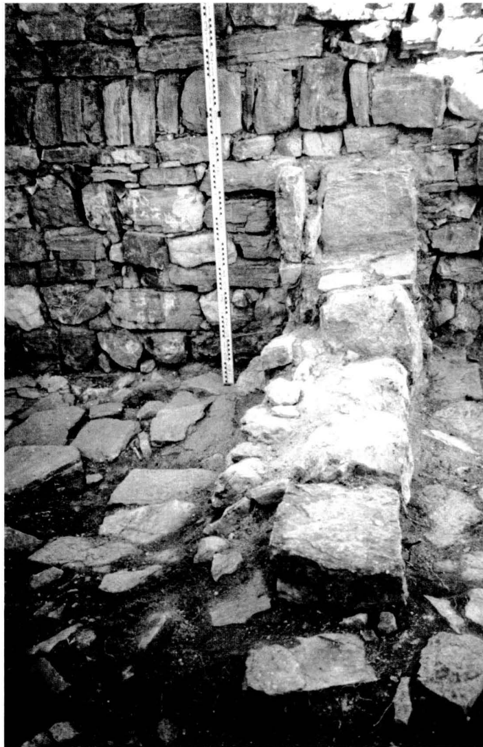
Detall del mur i del paviment de la sala residencial: es pot veure un dels murs divisoris de l'àmbit amb el paviment de lloses i part del parament del mur nord.

La tasca que es realitzà al mur nord també fou important, ja que a mitja alçada presentava un important esvoranc que en feia perillar la seva conservació. La intervenció es centrà en el sane-