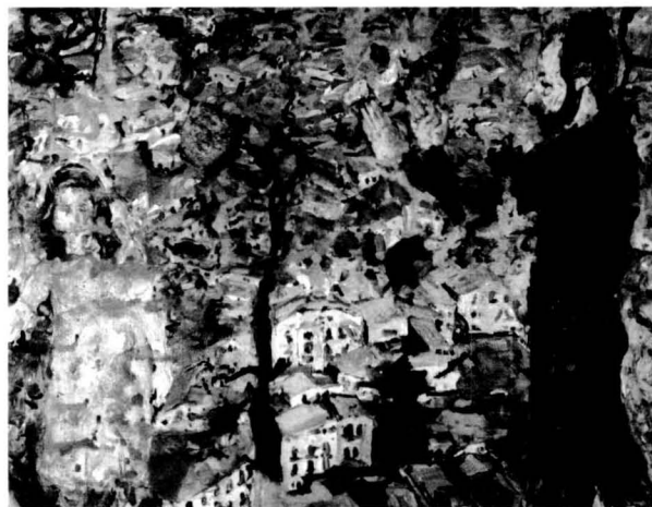
Davant el paisatge de la seva vida. Pintura de Xavier Franquesa.

I això ja no és culpa dels anys de franquisme; diria jo que més aviat la culpa és dels de sempre, d'aquells que s'adapten a qualsevol situació amb els seus mètodes especulatiu i caciquistes, propis de l'entramat polític constructor, que té una implantació gairebé mafiosa a la nostra ciutat. Perquè gairebé no es pot explicar per altres raons l'aglomeració i la foscor en què viuen els veïns de molts carrers del darrer eixample.