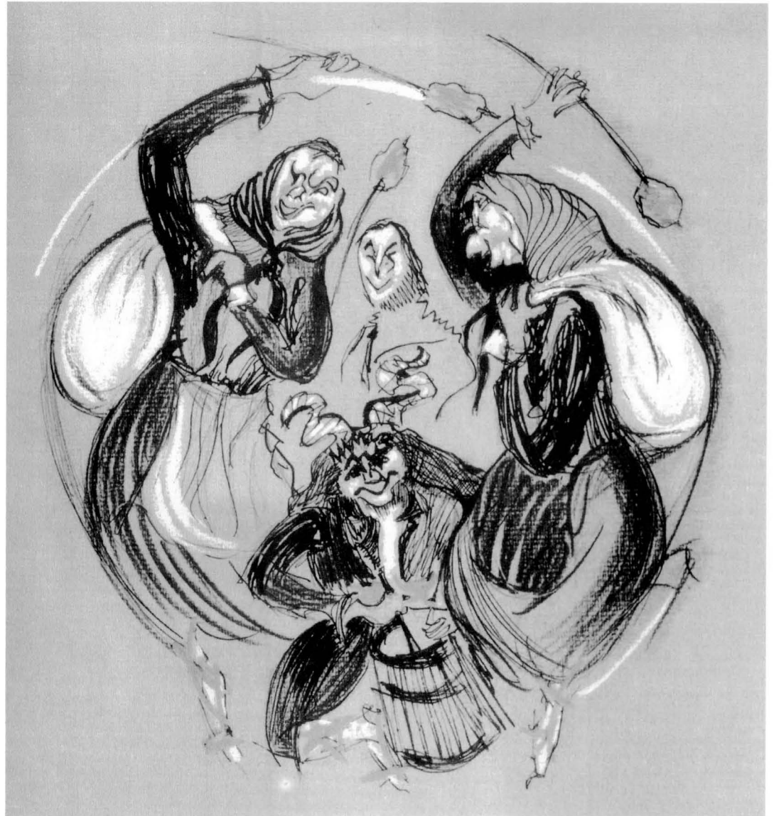
Dibuix de l'artista berguedà Gero sobre Els Moliners, per a la portada de L'EROL núm.8

El mal de la Pobla fou conegut per tots els pobles de la rodalia, i ben prest foren cridats els curanderos de més renom que vingueren de Matamala, les Lloses i Sant Jaume de Frontanyà. Aquests curanderos després de “visitar” i “examinar” detingudament tots els malalts, varen “dictaminar”, afirmant de manera categòrica que el mal que