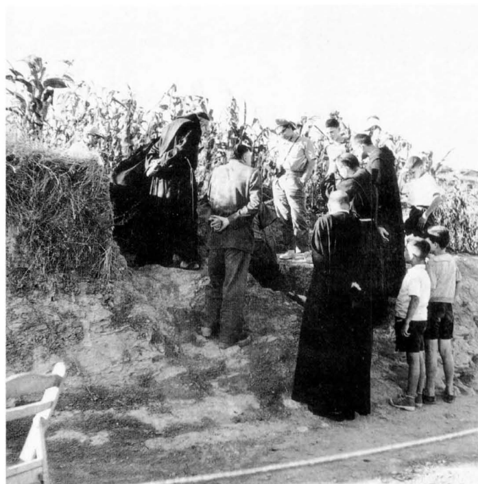
El dia 13 d'agost de 1959, els monjos de Montserrat visitaven les excavacions del jaciment de Casa en Ponç.