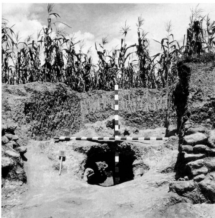
El forn número III, una vegada finalitzada la seva excavació.