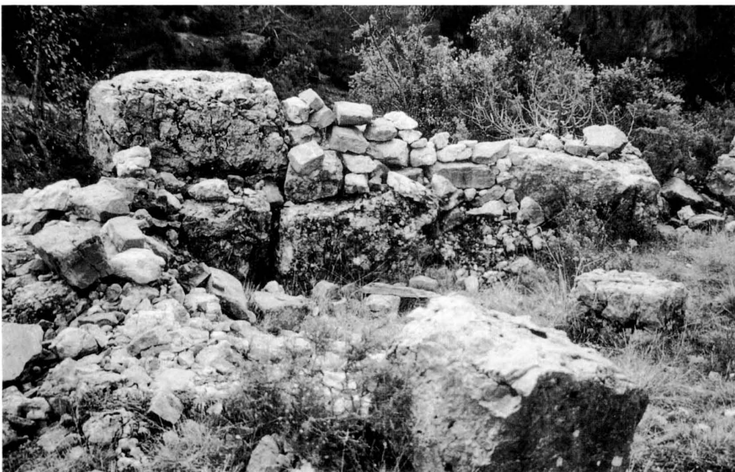
Antic poblat de Palomera, a Saldes. R. VILADÉS

Perquè l'arqueologia obria un nou concepte en el camp de la historiografia medieval: l'ús de dades empíriques analítiques i la seva contrastació amb les dades obtingudes a través de les fonts escrites. Això va obligar a revisar els paràmetres emprats fins ara en història medieval: demografia, urbanisme, construcció, tecnologies de producció, dieta alimentària, són alguns camps