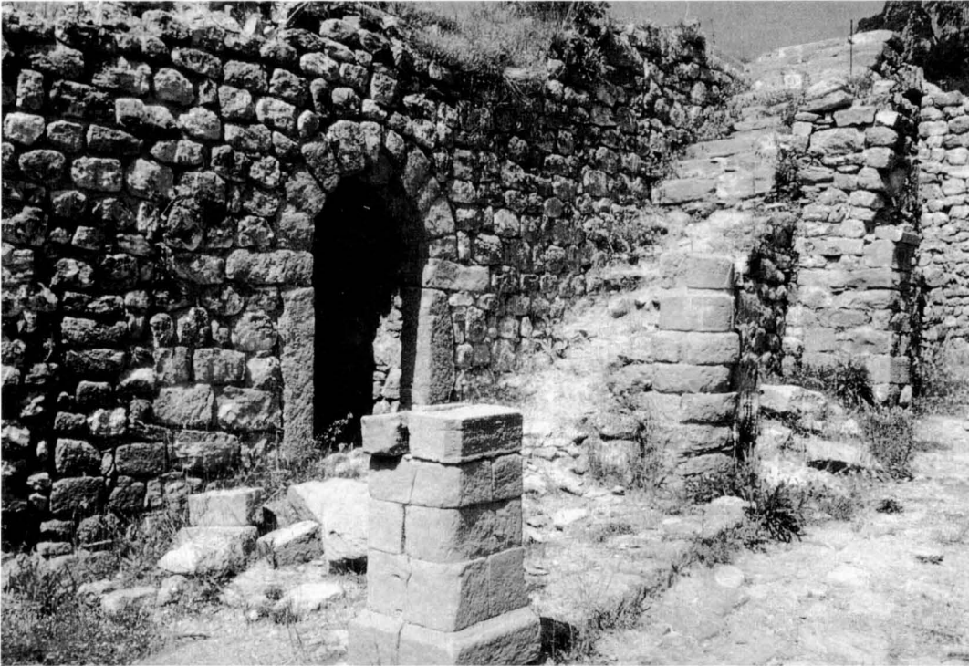
Castell de Mataplana, a Gombbrèn, una altra excavació del Dr. Riu. R. VILADÉS

països, reduïa la informació a les dades obtingudes a través d'excavacions arqueològiques. Exactament el cas contrari del que passava a Catalunya, un país amb una riquesa tan gran de documents escrits, que no calia ni excavar.