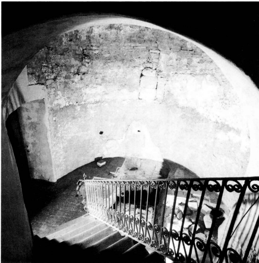
Interior de la rotonda amb el Martyrium, a Sorba. M. ESCOBET

rural andalusí abans de la reconquesta cristiana.