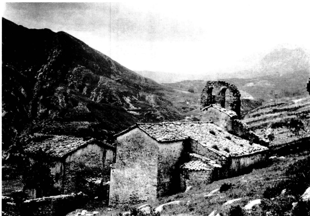
L'església de Sant Quirze de Pedret, cap al 1920. VIDAL I VENTOSA, SPAL.

Tot sembla indicar que a partir del segle XI, el «lloc» de Pedret va augmentar i consolidar la seva població. En un moment indeterminat d'aquest segle es va poder redactar l'esmentat llevantador de rendes de la Seu d'Urgell, falsament datat del segle IX. En aquesta acta ja hi surt l'església de Pedret, que pagava a la canònica quatre pernils de cens, fet que podria indicar que, en aquest moment, l'església ja havia adquirit la categoria de parròquia.