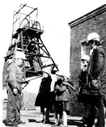
BLAENAFON, SOUTH WALES

majoria dels altres indrets enquestats. Per tant, aquestes són dues variables que fan que el turisme de patrimoni industrial i miner en aquest país britànic tingui un alt grau d'experiència i acceptació entre el públic, com per poder afirmar que es troba consolidat en el mercat turístic (bàsicament nacional).