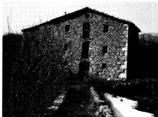
Vilardell. 1971-1981

La Sala: Masia situada a uns 3,5 km de la Pobla i a una alçada de 830 m sobre el nivell del mar. L'edifici, molt