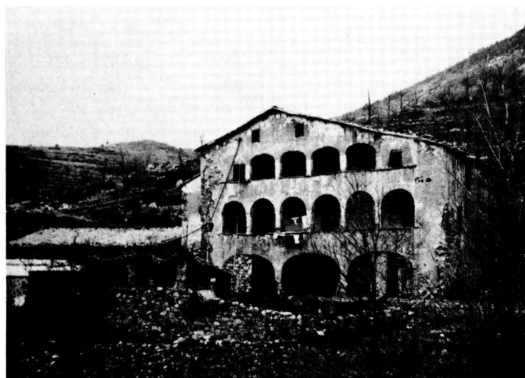
El Bruc. 1971-1981

Junyent: Masia situada a un 4 km de la Pobla i a 1.100 m d'alçada sobre el