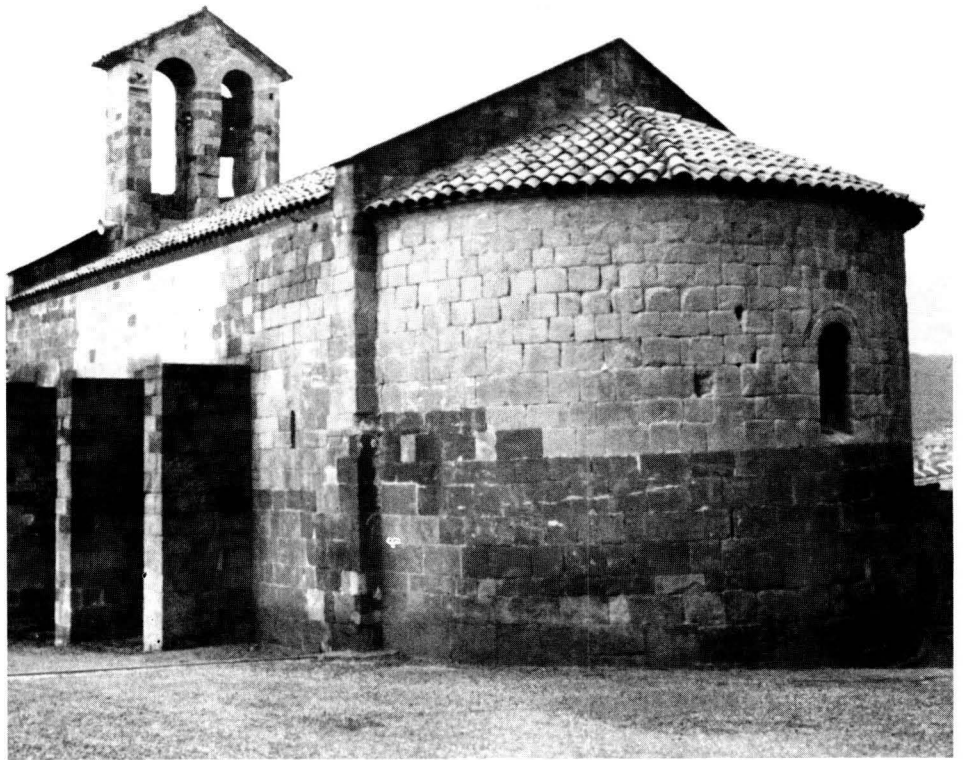
Sant Martí de Puig-reig.

Conscient de la seva situació —ara és només un petit senyor feudal—, opta per deixar la part més important del seu patrimoni, el castell de Puig-reig i Fonollet, a l'orde militar del Temple, i la resta dels seus béns els reparteix esmicoladament entre els hospitalers, Santa Maria de la