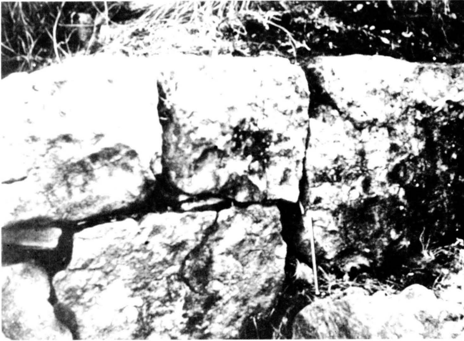
Fragment del mur del probable castell de Madrona, situat sobre el santuari de Queralt