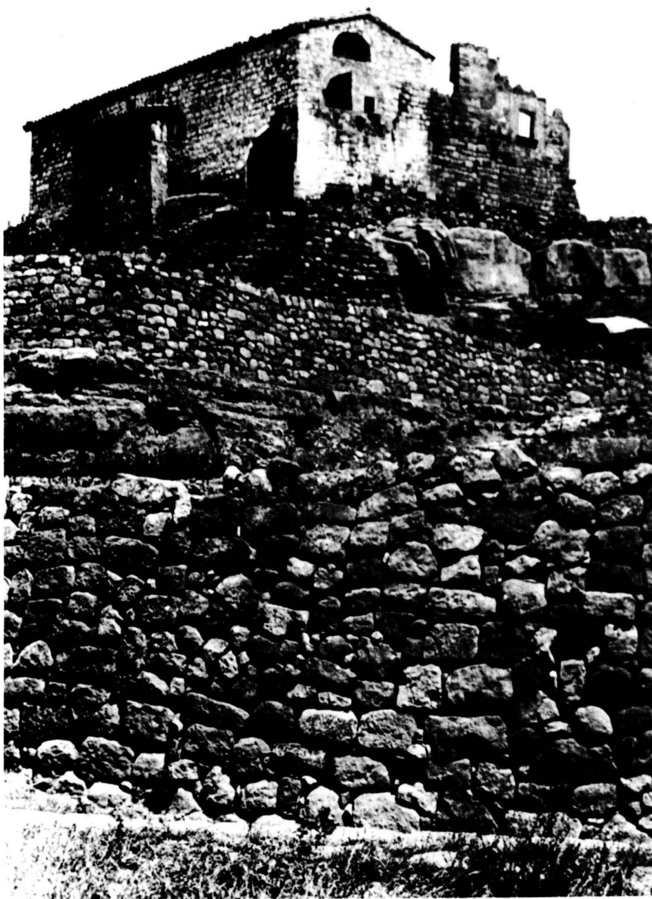
El castell de Puig-reig a començaments del s. XX.