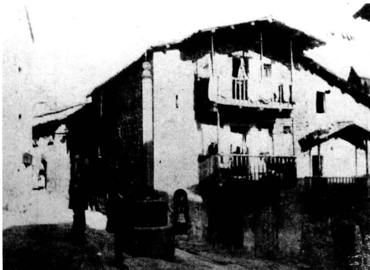
Plaça de Casserres

i 4 maravedisos-, el fet que la que ens ocupa no hi sigui present ens fa pensar que era totalment complementària i esporàdica.