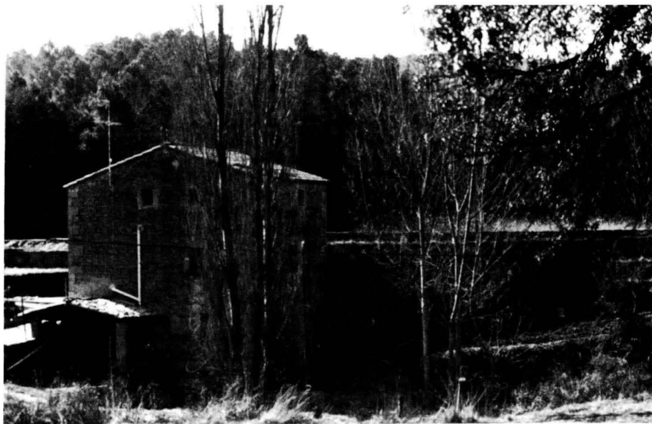
El molí del Lledó, situat al peu de la riera de la Sala, és l'altre gran molí fariner que va funcionar a Puigreig fins a finals del s. XIX.