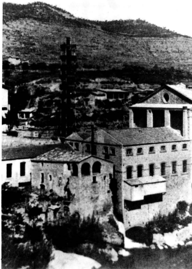
Molí de cal Casas a finals del segle XIX

A Francesc Payssa, Bartomeu Payrot y Joan Payrot mestres de cases d'Alpens, «a bon compta del preu fet del Molí de Puigreig com consta de sas rebudas de data 21 de (Ge-