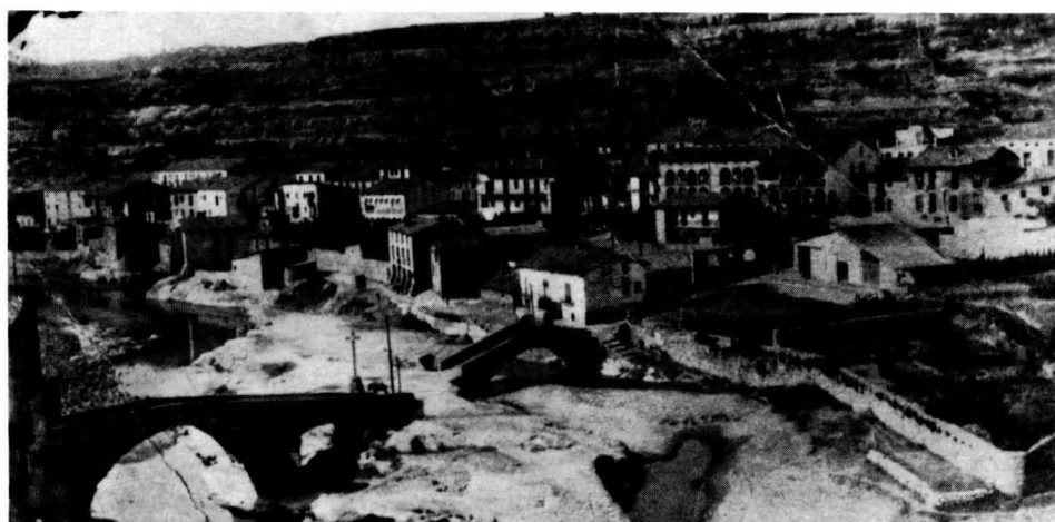
Vista parcial de Gironella a començaments del s. XX. El Comú de la Vila de Gironella va fer funcionar el molí de Puig-reig des del s. XVI fins a finals del s. XVIII