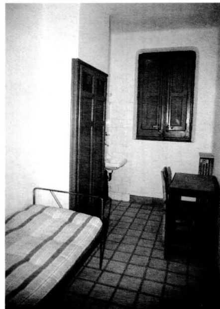
Habitació d'un seminarista.

Allò que era encisador de veritat era el mes de maig. Ah, com el recordo! Cada dia, com a final de la celebració, cantàvem els goigs d'alguna Marededéu: «Assistiu-nos, gran Senyora, de Falgars intitulada...» Amb les finestres, ben obertes, la flaire primaveral dels arbres i les plantes que entrava capella endins barrejant-se amb els refilets dels ocells