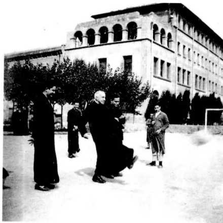
Tot jugant a futbol.