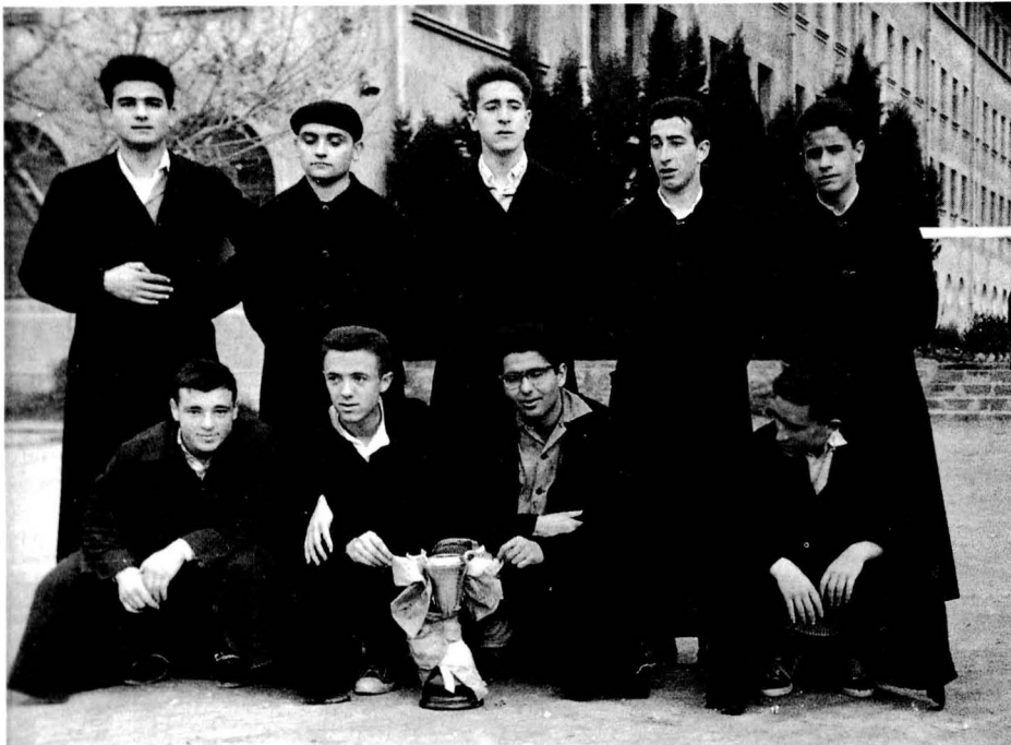
L'Equip de Filosofia (1959).

En resum: gràcies al seminari som el que som els capellans i, en certa manera, tots els fidels solsonins: som el que som i tal com som. Déu ens hi conservi en allò que tenim de bo i ens ajudi a superar-nos. Al cap d'allà som molt joves: només tenim 400 anys! ⚡