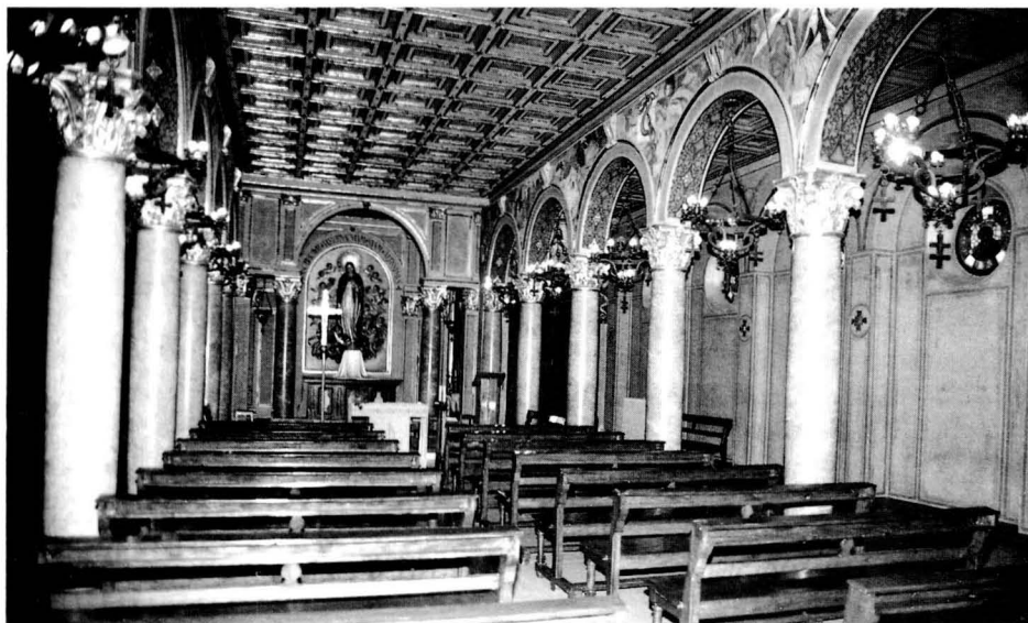
Capella del Seminari.