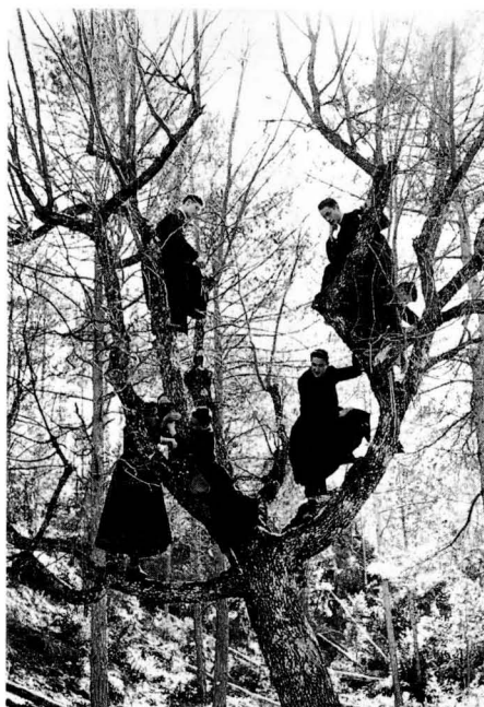
Una tarda d'esbarjo (1959).

Podríem baixar a molts més detalls de la vida d'aquell temps, però no acaba- ríem mai: els certàmens literaris de la Puríssima on tots els capellans lletrafe- rits del bisbat havien esmolat les seves armes; les vetllades de sant Tomàs; la missa conventual dels diumenges del matí a la catedral, amb aquella renglera de canonges al fons del presbiteri tot fantasmagòrics; les vespres dels diu- menges a la tarda tan gregoriantament celestials; les vacances de Nadal i d'estiu (les de Setmana Santa les va suprimir el bisbe Tarancon); els dies de recés; les tandes d'exercicis espirituals; la funció sabatina, etc., etc., etc. I de tant en tant, com deia, algun sis d'octubre a la cel- la del rector. I les notes al final de curs: Meritus, Benemeritus (en b minúscula i B majúscula), Meritissimus, Laureatus... Hi ha un fet extraordinari que no me'l puc deixar al tinter: la publicació, el mes de març de l'any 1950, de L'Infantil , aquella revisteta de no-res que va co- mençar essent un full propagandístic del Dia del Seminari i es convertiria en la primera revista infantil de la postguerra a Catalunya. La il·lusió i les