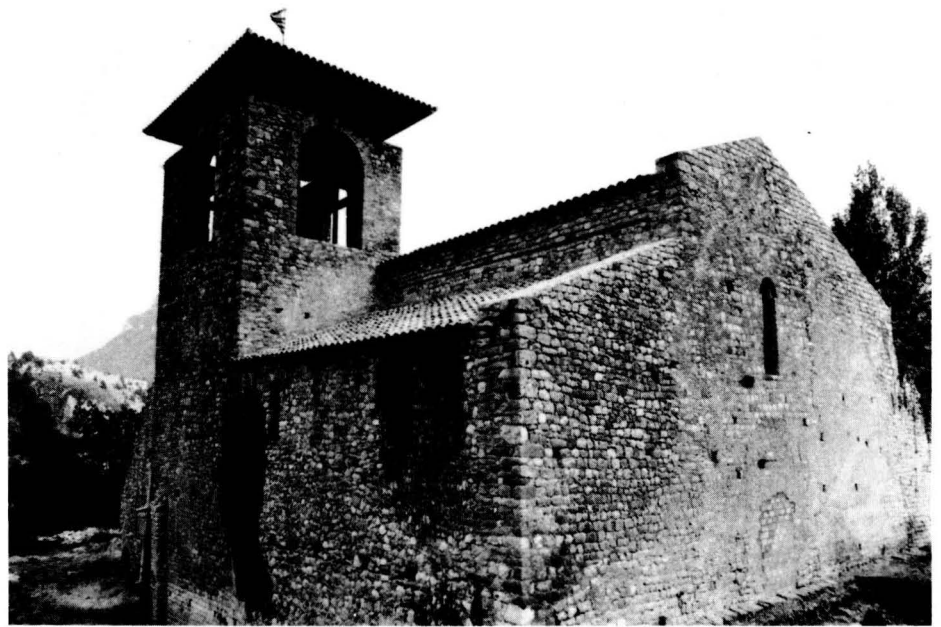
Sant Llorenç prop Bagà.

A l'entorn de 1592 foren agregats com a priorats al monestir de St. Pau del Camp de Barcelona, amb tots els seus drets i possessions. El patrimoni de St. Llorenç, a més de molts llocs de l'entorn, comprenia gran part del terme de Salo. Hi residien alguns monjos durant els primers anys del s. XVII. De la Portella en depenien moltes cases dels pobles de la Quar, Pedret, St. Maurici i altres llocs, i l'abat o el prior presentava el rector d'aquestes parròquies.