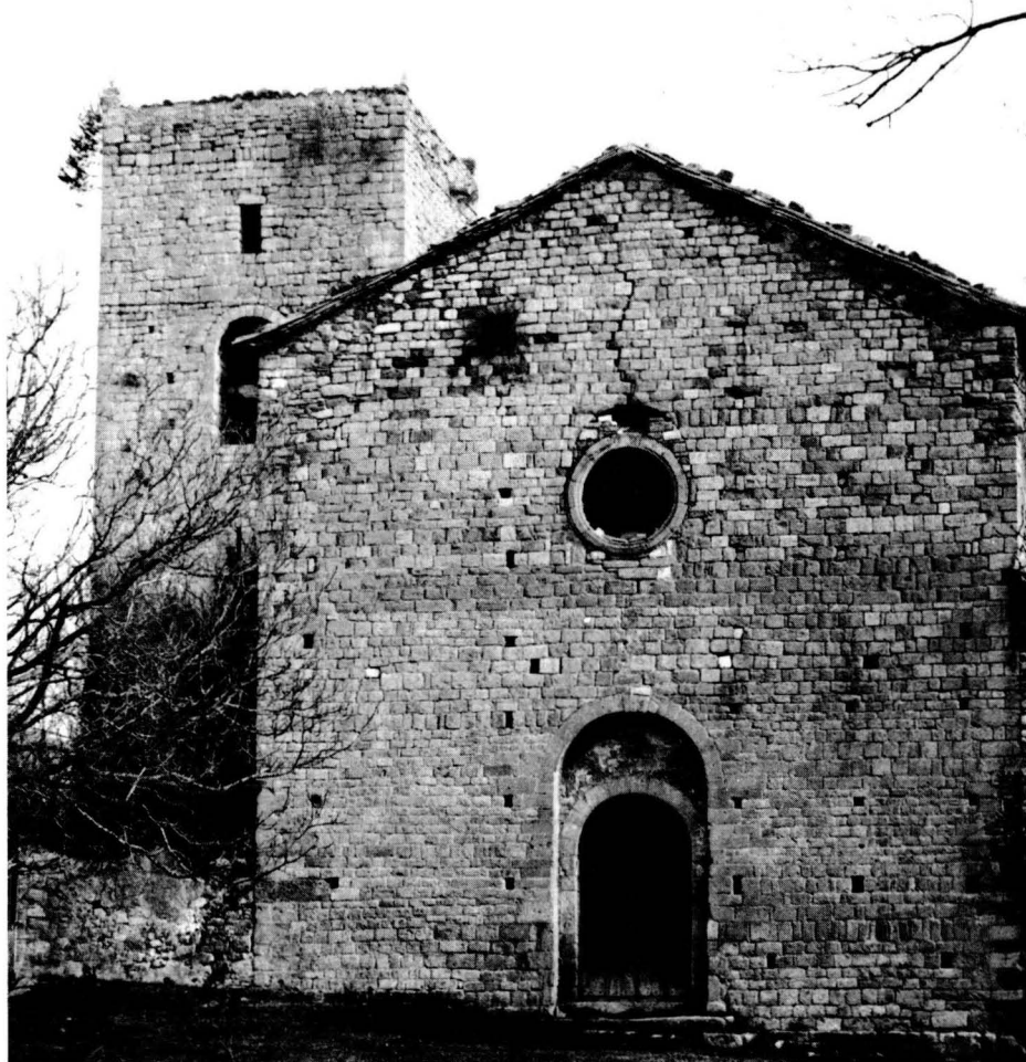
Sant Pere de la Portella.

A la comarca del Berguedà, el monestir de Sta. Maria de Serrateix perdurà fins a l'exclaustració. Rebia censos de les