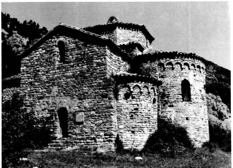
Sant Pere de Grau d'Escales.

És normal que els ordes mendicants, que tenien un patrimoni territorial molt