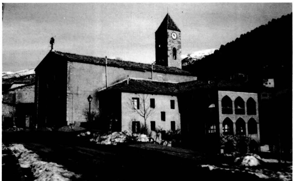
L'església de Gósol ja ha fet 100 anys.