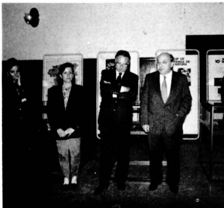
A Berga, la inauguració va ser presidida per l'alcalde i president del Consell

Aquesta exposició es va muntar per celebrar el desè aniversari, amb el patrocini de la Diputació de Barcelona i la Caixa de Manresa, i la col·laboració de la Generalitat de Catalunya i els ajuntaments de Berga, Bagà i Guardiola de Berguedà.