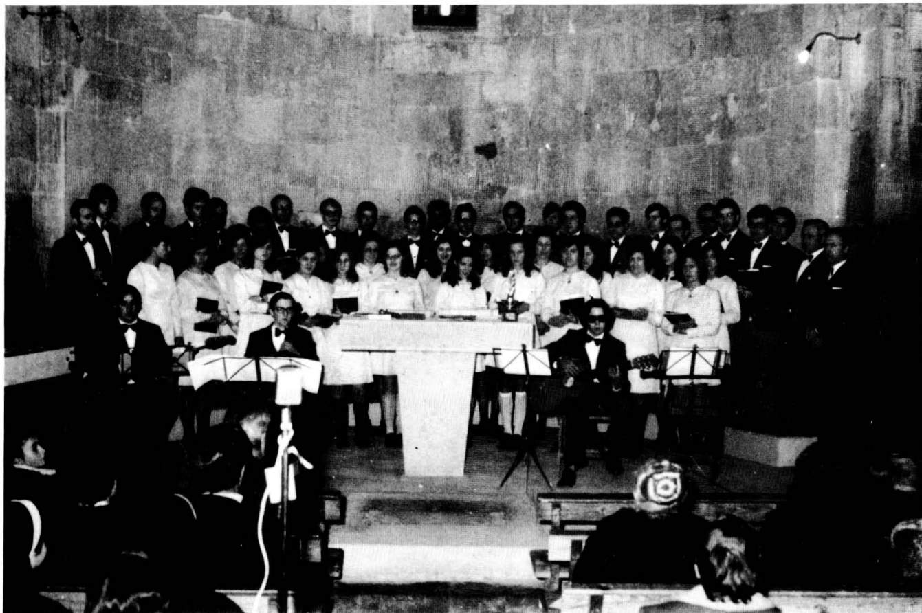
La Coral Joventut Sardanista en el concert de Nadal a l'església de St. Martí de Puig-reig. 26-XII-1973.