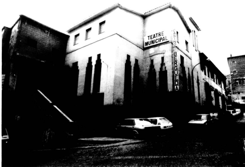
El Casino, avui.

bretot pel que fa als elements decoratius i als materials.