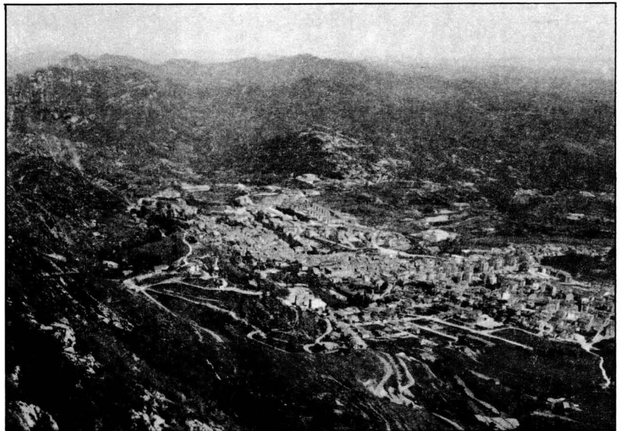
Vista de la vall berguedana des de Queralt.

Aquest fet incideix en que la vall s'estengui molt en latitud, la qual cosa fa que en conjunt es presentin dins de la conca diferents tipus d'ambients i de paisatges. Sembla clar que es poden considerar tres sectors principals: un que correspon a l'alta conca, d'ambient alpi i subalpi; un sector central de característiques més o menys continentals i interiors, i finalment un sector baix mediterrani.