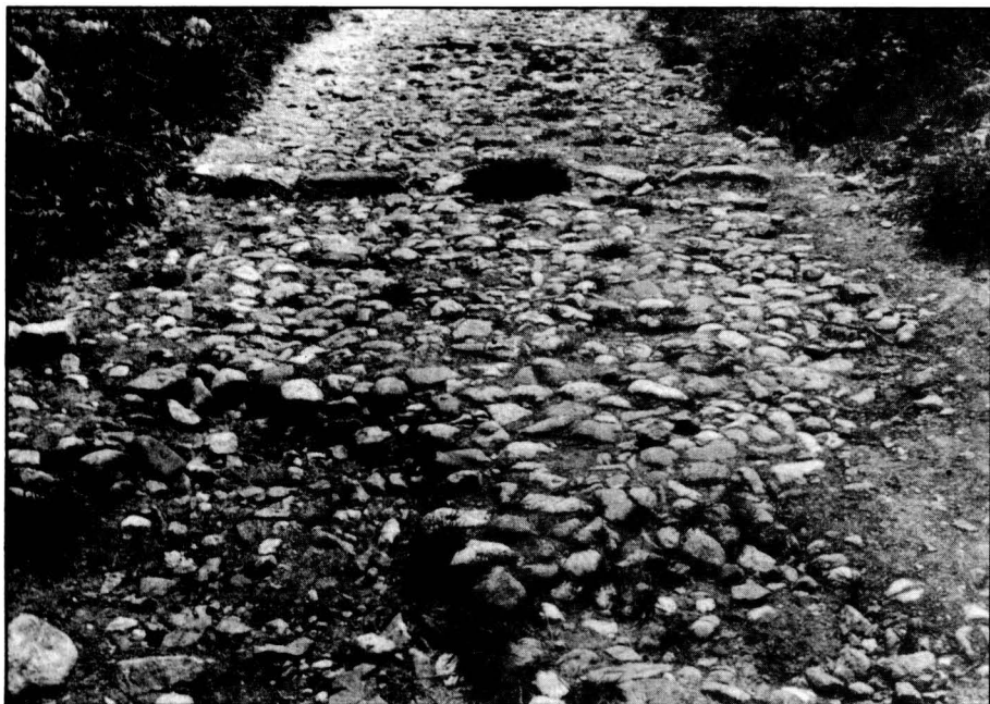
Detall d'empedrat d'un camí ral del Berguedà.