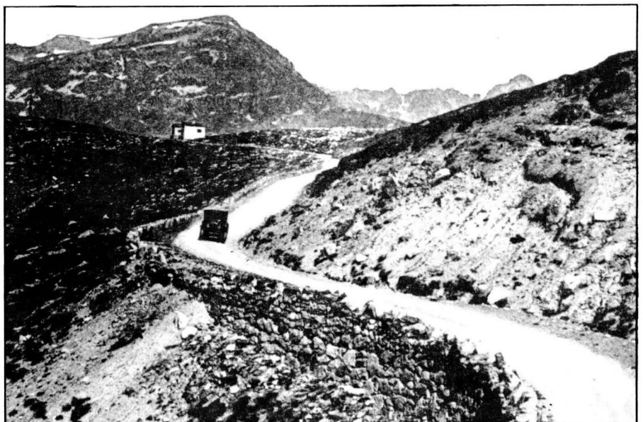
Coll de Puimorens.

L'alta conca del Llobregat és un sector de relleu abrupte propi del sector axial pirinenc i del Pre-pirineu. La pluja hi es abundant (més de 1.000 mm anuals) relativament ben repartida durant l'any i com que les temperatures no són pas gaire altes —les mitjanes anuals són inferiors a 10°C— l'ambient hi és humit fins i tot durant l'estiu. La vegetació és representada o bé per prats de tipus alpi, en els sectors més alts, o bé per boscs de pi negre ( Pinus mugo ssp. uncinata ) amb sotabosc de neret ( Rhododendron ferrugineum ), ossona ( Festuca gautieri ) i ginebró ( Juniperus communis ). La zona superior, de prats oberts i destinada a pastures d'estiu tradicionalment, contrasta amb la tonalitat fosca del bosc de pi negre, principalment a l'hivern moment en que el fons blanc de la neu fa que destaquin encara més els negres arbres. Actualment és el