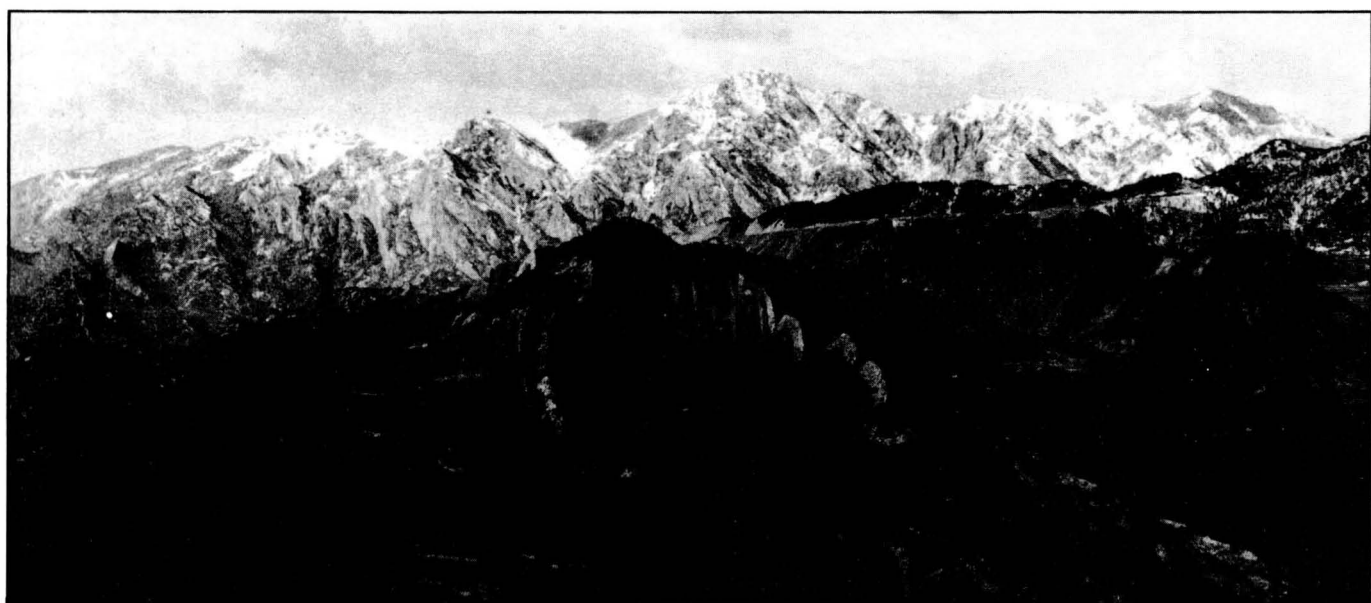
Carretera de Coll de Pal.