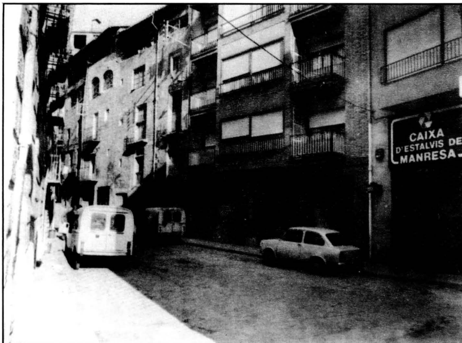
El Molí de la Vila, era on hi ha, actualment, una entitat bancària.