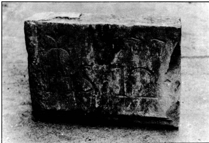
Carreu que proclama la medievalitat del Molí.

La primera notícia que tinguérem del Ball dels Moliners 5 ens arribà en forma de rondalla-llegenda: "hi havia un moliner a la Pobla, fa molts anys, que feia créixer les mesures de farina barrejant-la amb cendra. La gent de la Pobla, al cap d'un temps, va començar a emmalaltir, i ningú sabia d'on podia venir aquell mal tan estrany. Quan, d'alguna manera, s'assabentaren de la culpabilitat del moliner, les dones del poble el van apallissar violentament, entre totes, i el van fer fora de la Pobla —encara que al pobre home no li devien quedar ganes de seguir vivint-hi—. Per aquest motiu, a la Pobla, cada dimarts de Car-