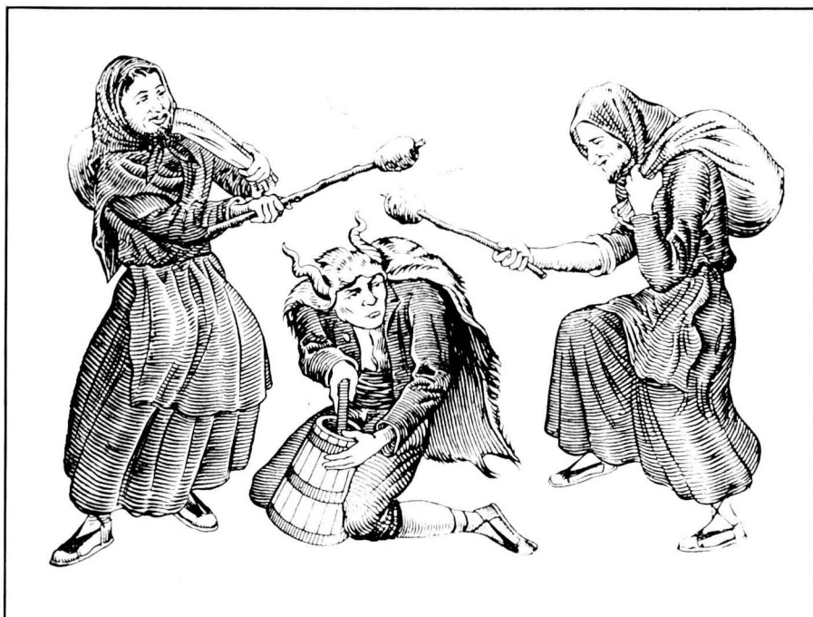
El “Ball dels Moliners” segons un dibuix del Costumari de J. Amades