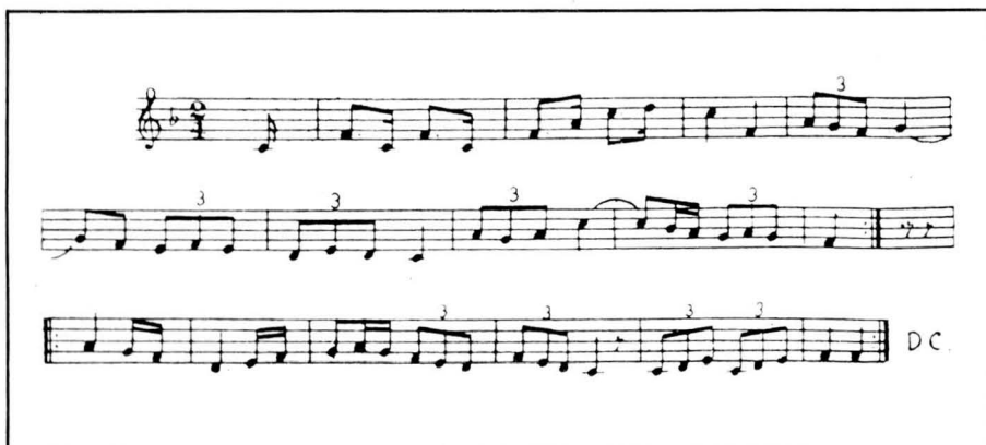
Música de "El Ball dels Moliners", interpretada amb un flabiol i un tamborí.

Inversió sexual, subversió de l'ordre social per mitjà de la violència col·lectiva, enterrament de l'esperit de l'hivern en la forma d'animal pelut, i utilització d'elements naturals de caire simbòlic i dual —la cendra i la farina—, doncs, els trets característics que hem pogut entreveure en aquest ball i que fan que puguem inscriure'l, perfectament i amb tots els drets, dins de l'extens mosaic de manifestacions del Carnestoltes a casa nostra.