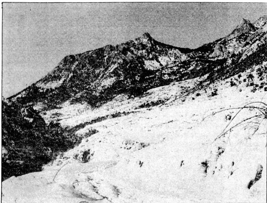
El Cim d'Estela i el Roc d'Auró.