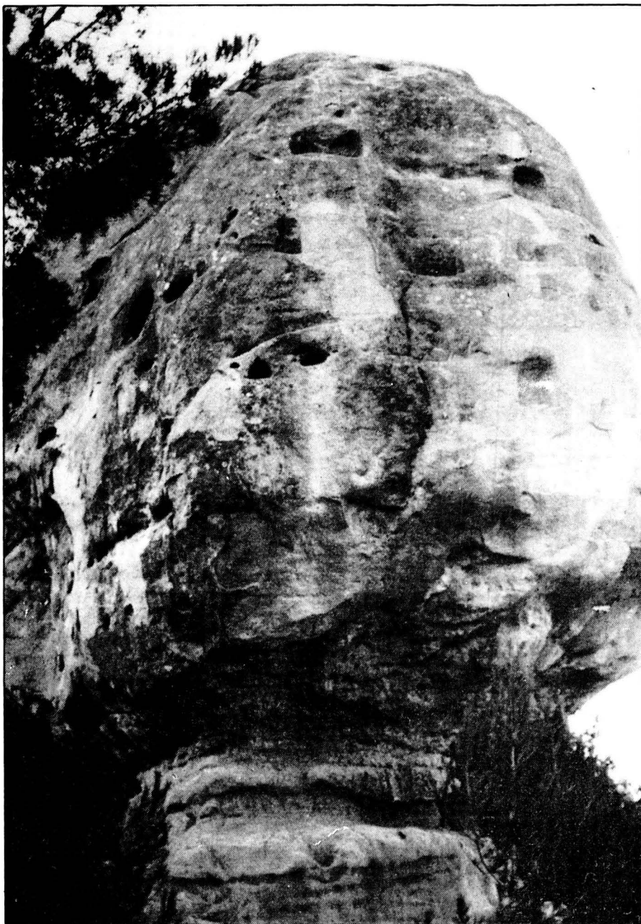
El Castellot de Viver i Serrateix.

Només un episodi d'aquest període té per protagonista les terres catalanes, i en concret les de la Catalunya