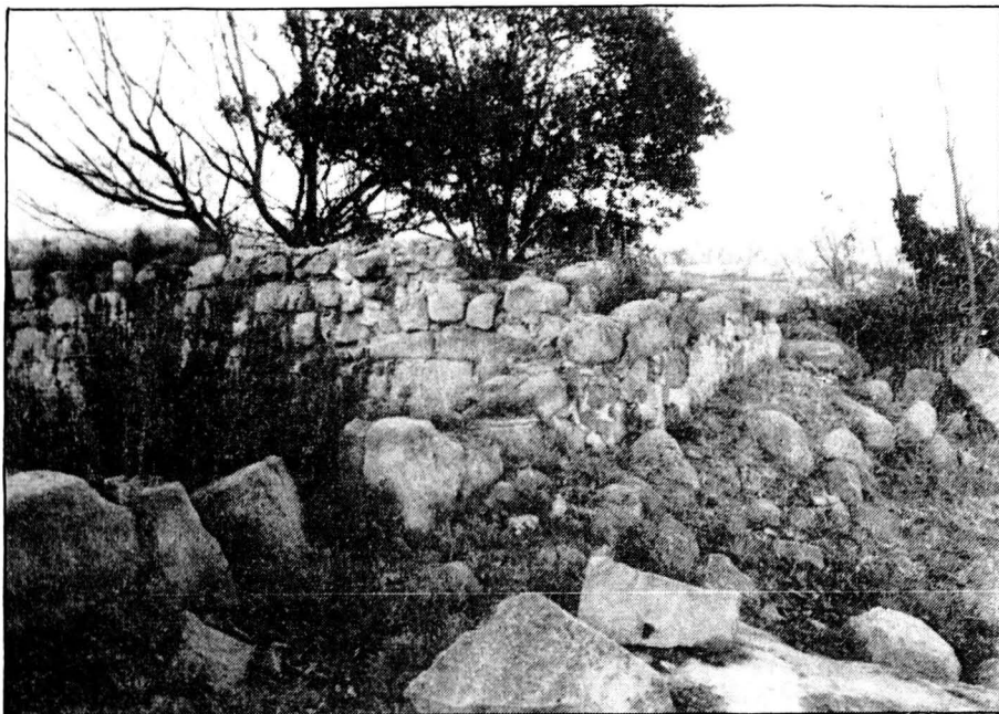
Una altra vista de les restes del Castell de Viver i Serrateix