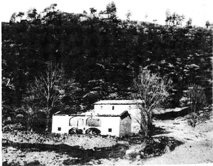
El despoblament afavoreix els incendis forestals.

Cal fer esment d'una minsa recuperació de poblament en els municipis, que la seva evolució era eminentment agrària, i sofriren una pèrdua notable de llurs habitants, i a partir de la dècada dels setanta s'ha iniciat un cert repoblament amb vivendes de segona residència, pels atractius de placidesa paisatgística que ofereix la nostra comarca i també a una millor potenciació de la seva infraestructura com carreteres i xarxa elèctrica. S'organitza al seu entorn una incipient indústria turística i hostalera.