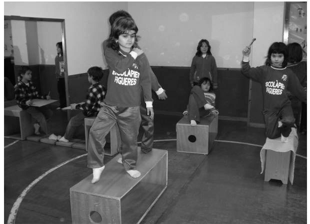
Figura 5. Trabajo corporal y sonoro sobre diversas esculturas de la ciudad de Figueres

trumental, y la corporal, concluye de forma global y participativa todo el trabajo realizado por separado. Resumiendo, el trabajo corporal, trasponiendo con el cuerpo y el sonido la visualización de la escultura, permite a los alumnos que participan activamente y a los espectadores que lo visualizan y escuchan una lectura enriquecedora y diferente del acto de percibir un objeto artístico, en este caso una escultura urbana.