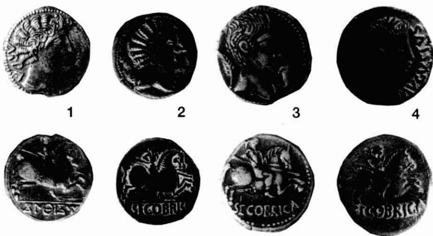
Figura 1. - Amb la llegenda ibèrica KONTEBAKOM KARBICA. 2. - Amb la llegenda llatina SEGOBRIGA i tipus ibèrics. 3. - SEGOBRIGA amb cap d'August, sense titulatura. 4. - SEGOBRIGA amb AVGVS TVS DIVI F.

amb tota certesa que les dues mostres procedeixen de la mateixa població i han estat encunyades amb el mateix sistema metrològic i seguint la mateixa tècnica.