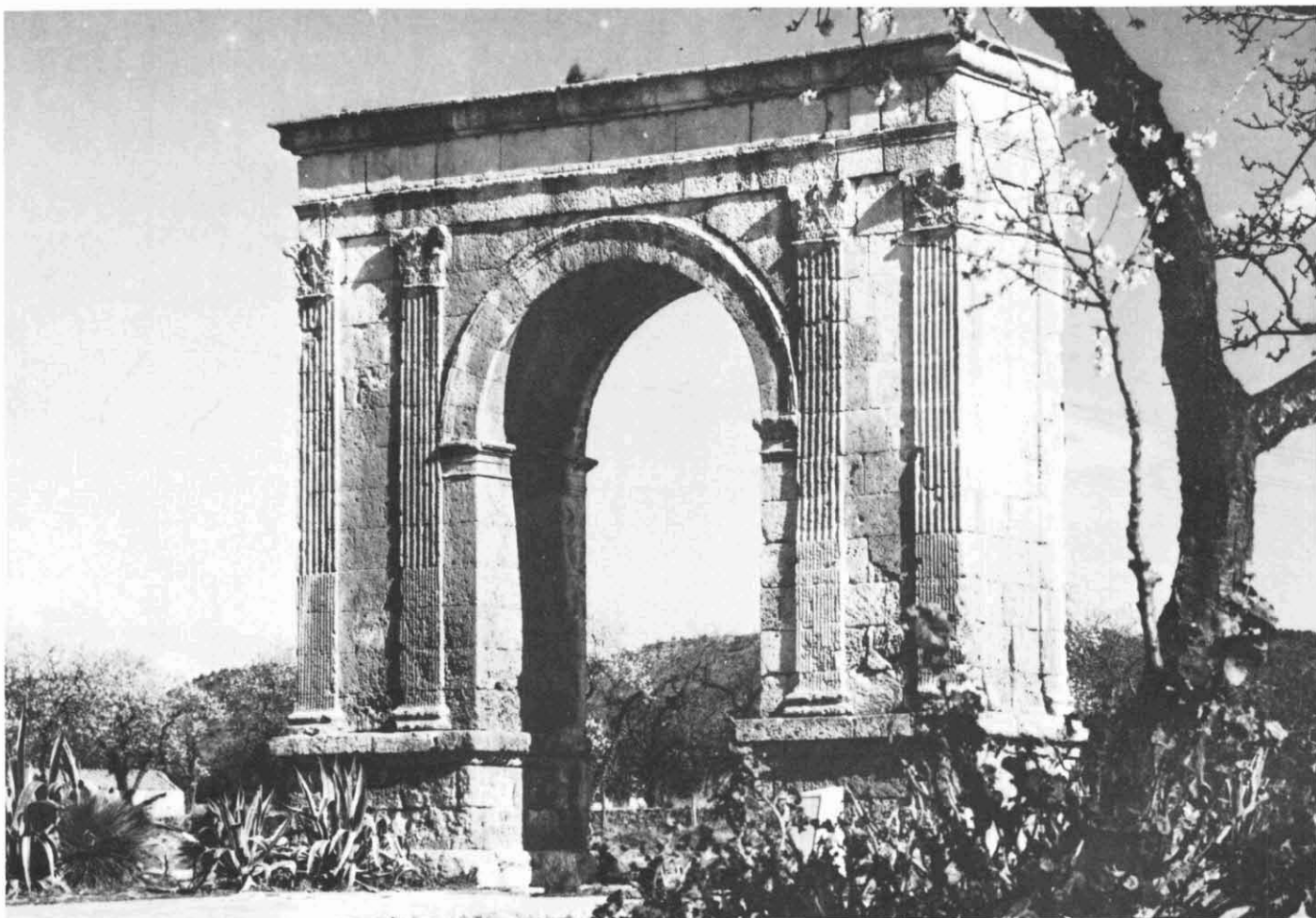
Lám. I. — Vista de la façana Sud-Oest de l'Arc de Berà (Roda de Berà, Tarragonès).

angles del capitell. Els lòbuls centrals de les fulles de la segona corona presenten un relleu més pronunciat i superen una mica l'alçada dels caulicles. Les fulles d'acant són de forma lanceolada i les zones d'ombra són triangulars i en forma de llàgrima, tot plegat força naturalistes. Les fulletes del lòbul superior de les fulles d'acant de la primera corona se sobreposen a les fulletes del lòbul inferior de les fulles d'acant de la segona corona.