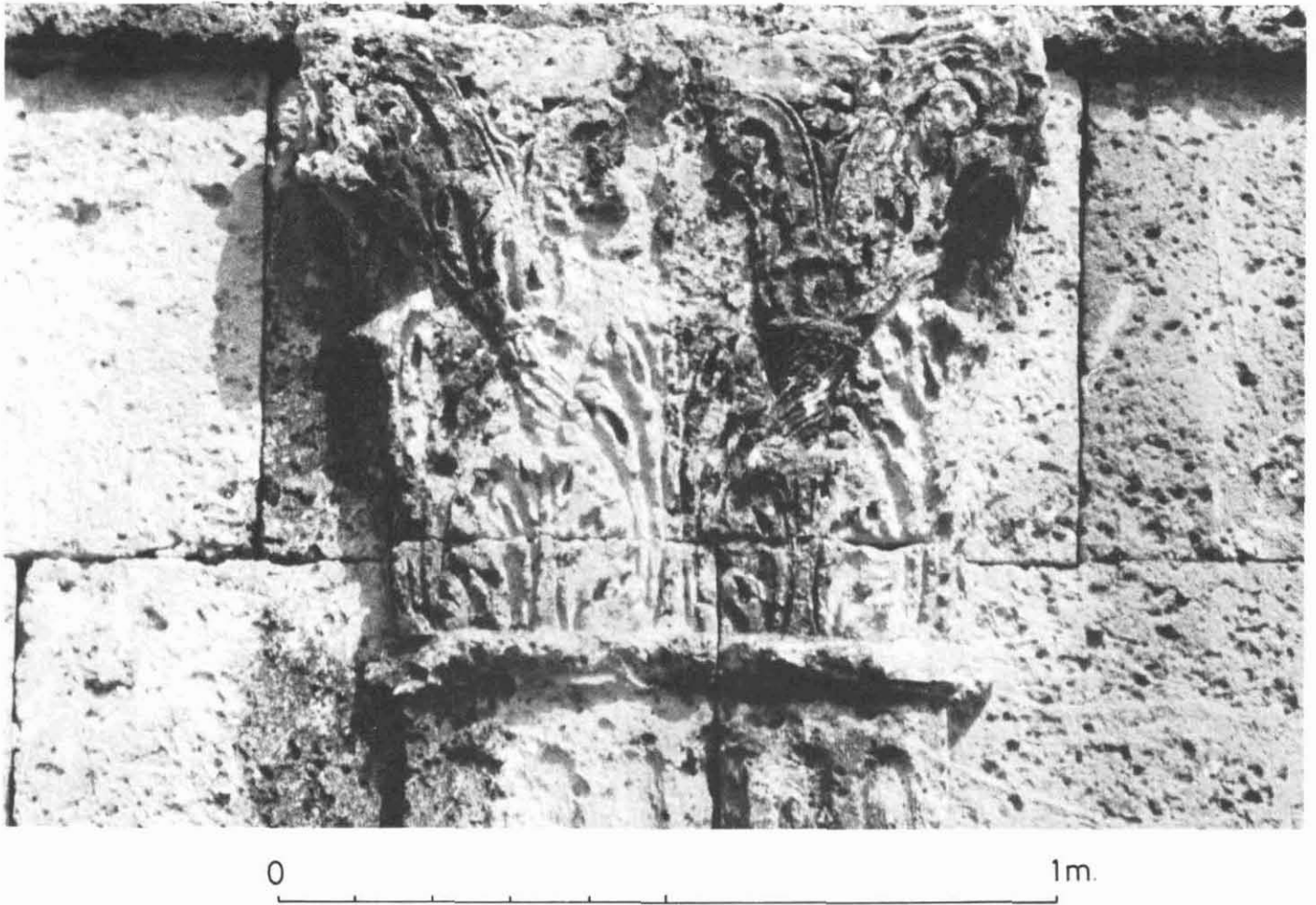
Lám. II. — Capitell de la pilastra dreta del pilar Nord de la façana Sud-Oest de l'Arc de Berà. Aquest és el capitell que es troba en millor estat de conservació.

per la tija de la flor de l'àbac; aquesta flor té forma ovalada i està envoltada per una corona de fulles.