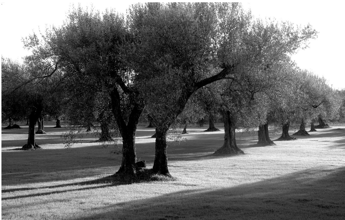
Oliveres, Baix Maestrat

El volum en qüestió s'anomena ara Viatge pel País Valencià i inclou una "Introducció" clarificadora, que comença amb una lamentació molt característica: "No diré pas que a contracor, ni de bon tros, però sí una mica