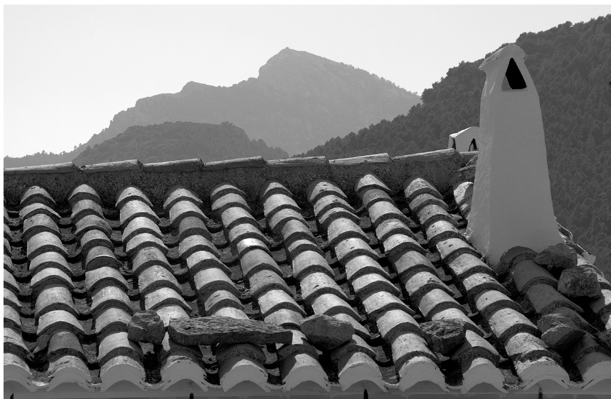
Penyagolosa des de Xodos

A les Useres troba dues mil ànimes (ara ja en són només la meitat) malvivint en "una trista soledat d'erms i roques pelades". L'ambient, però, no li resulta desagradable, ans perfectament adequat a la cerimònia per la qual és coneguda la vila: el pelegrinatge ritual al Penyagolosa cada darrer divendres d'abril. Fuster li dedica una atenció sumària, potser perquè ell mateix no era, segons va confessar, un "caminant exaltat" (sic). La celebració, d'origen medieval, sembla que és de procedència pagana, però posteriorment cristianitzada. Es recorren els trenta-cinc quilòmetres que hi ha entre la localitat i Sant Joan de Penyagolosa per invocar un oratge propici,