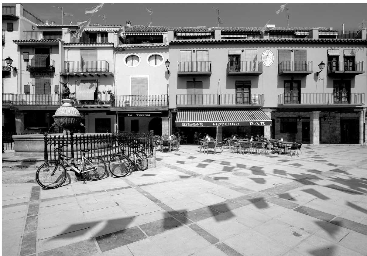
Sant Mateu: plaça Major

A Sant Mateu trobem la capital històrica de tot el Maestrat, llavors amb tres mil habitants