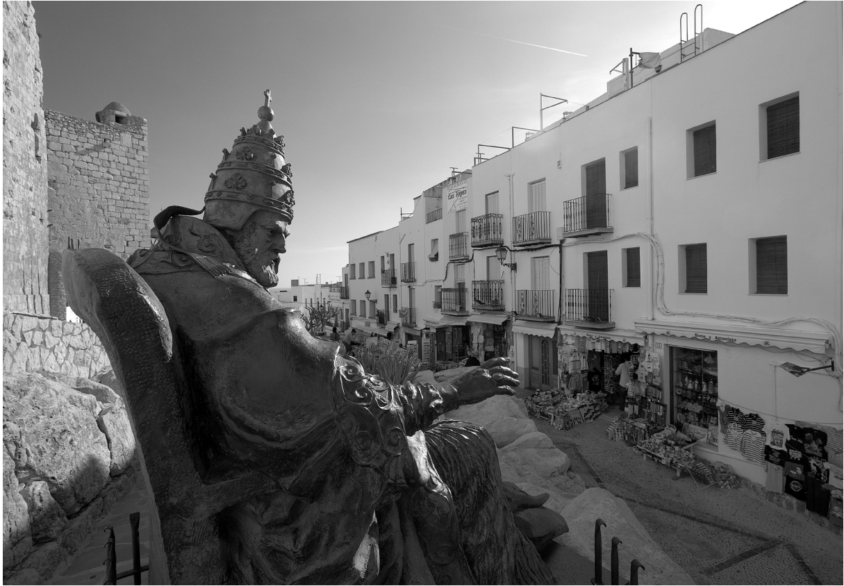
Peníscola: Papa Luna, Benet XIII

anys vuitanta, quan vaig fer el meu primer viatge — a peu — pel País Valencià, vaig arribar al davant d'aquests murs amb la meua motxilla i les butxaques molt escurades. Havia de fer-hi nit, així que vaig buscar un racó entre palmeres, al peu dels baluards dissuasius, i vaig passar una nit filosòfica perseguint els dos vectors de la moral kantiana: el cel estrellat sobre meu i la llei moral dins meu. A les sis del matí em van despertar les sirenes dels barcos, que ja eixien des del port contigu.