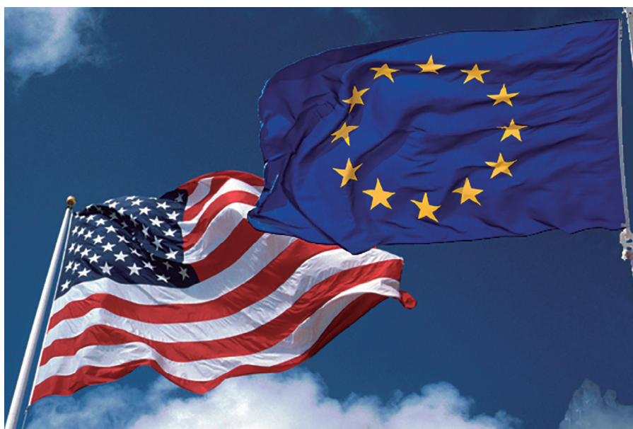
Cap als Estats Units d'Europa?

c) L'estatisme.— El gran problema de fons, davant la construcció europea, continua sent el nacionalisme d'estat. Tant les diverses manifestacions de la xenofòbia, com tots els populismes que, com a bolets, van sorgint ça i lla, com els desafiaments a la Justícia europea per part de determinats sistemes judicials estatals, formen part de la cul-