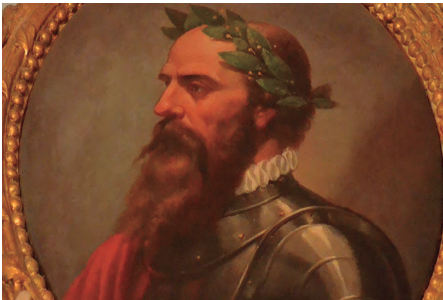
Ausiàs March, segons un retrat de la sala de personatges il·lustres del palau del Marquès de Dosaiçgues.

De tota l'obra d'Ausiàs March, el poema més extens, un dels més coneguts i, per descomptat, un dels més treballats és el seu «Cant