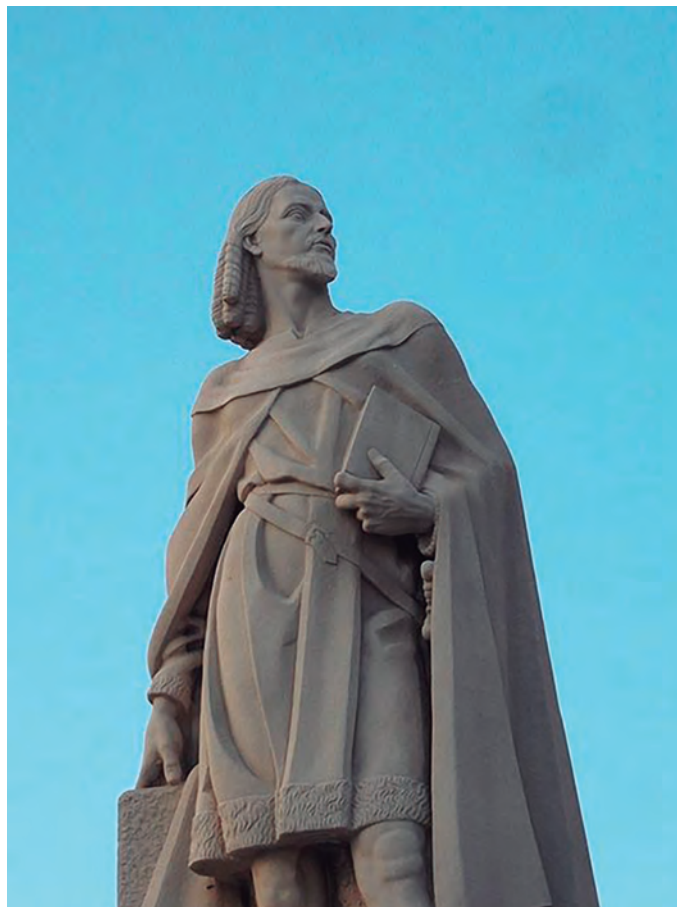
Ausiàs March. Estàtua del poeta a Gandia.

precipici. Ens duu a interrogar-nos i a demanar respostes, de vegades vehementment, sovint angoixadament.