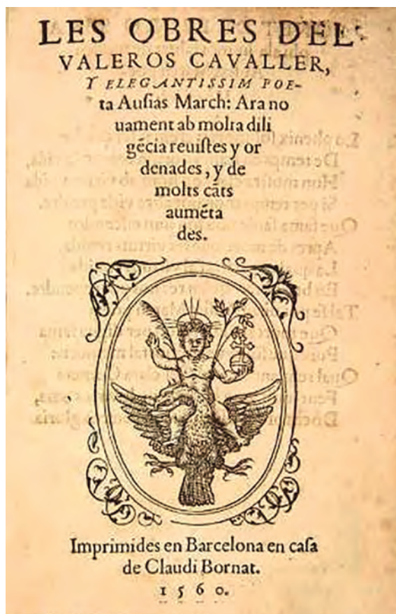
Portada d'una de les edicions antigues de les obres d'Ausiàs March.

ceptes religiosos i morals, fa que March arribi a pregar a Déu que li escurci la vida.