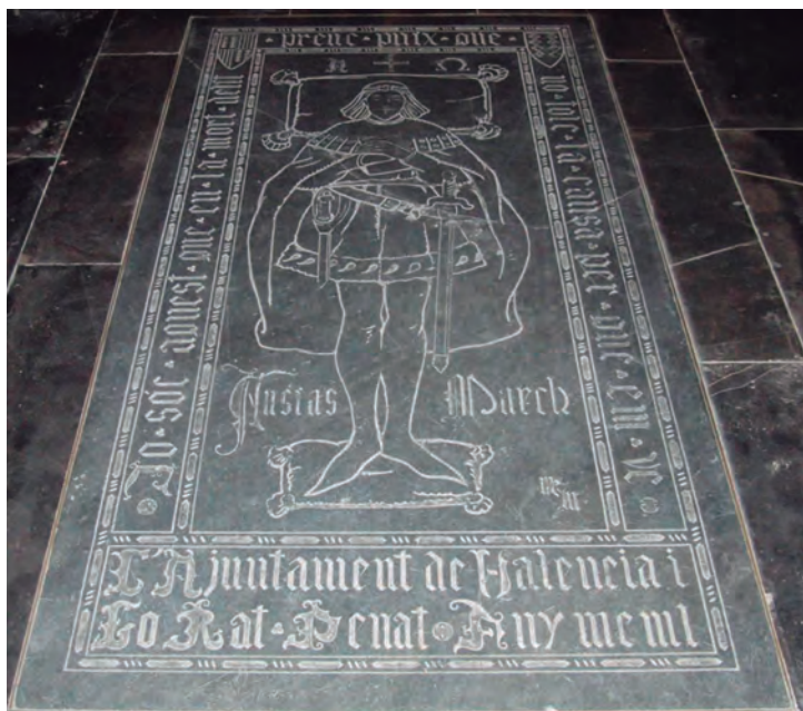
Làpida que cobreix les despulles del poeta Ausiàs March, a la catedral de València.

entre l'Edat mitjana i el Renaixement, però també fa aquest mateix paper en l'àmbit general europeu.