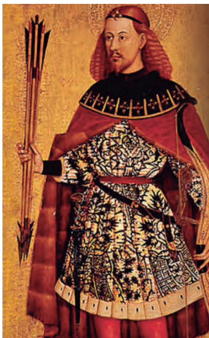
Ausiàs March sembla que fou el model de Jacomart per pintar sant Sebastià.

Recordem que la poesia trobadoresca es basava, fonamentalment, en convencions. Per començar, l'ús del provençal la koiné lingüística de la literatura trobadoresca per als trobadors occitans, catalans, francesos i italians confegia un aire d'«artificialitat» a la poesia trobadoresca. No fa falta dir que l'artificialitat i la civilització van de la mà, i que no hi ha civilització sense artificialitat. Per això, hem de constatar, com no pot ser d'altra manera, que la primera civilització una mica complexa i refinada dins la Romània va venir de la mà de la poesia trobadoresca, de l'amor cortès, de les corts occitanes. Malauradament, aquella civilització, la més florent a l'Europa dels segles XI-XIII, va topar amb la voracitat de França i del Vaticà, que decidiren liquidar Occitània. Certament, la nació occitana no s'havia articulat com un estat, ni tan sols com un regne. Però tenia una cosa que feia comunitat: la seua cultura, la cultura trobadoresca. Aquesta cultura també englobava els actuals Països Catalans. Segons com haguessin anat les coses, certament, hauria pogut néixer una nació occitano-catalana. Però Simó de Montfort i els seus ho varen