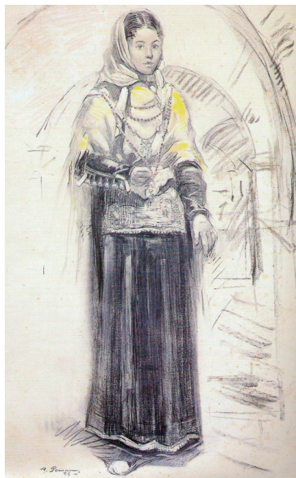
Obres d'Antoni Pomar Juan. Imatge superior a l'esquerra, "Natura morta". 1940. Oli, 66 x 81'5 cm. Imatge superior a la dreta, sense títol. 1950. Oli, 52 x 62 cm. Imatges inferiors: a l'esquerra, sense títol. 1957. Oli, 60 x 80 cm. I a la dreta, dibuix de la col·lecció Trajes típicos pitiusos , núm. 1 Vestit de Gonella , 1953. Edició de Diario de Ibiza , 1992. (Fons de l'Ajuntament d'Eivissa).

–1963. Sala d'Exposicions de la Caixa de Pensions d'Eivissa. Exposició de Dibuixos. Eivissa. Del 20 de setembre al 4 d'octubre.