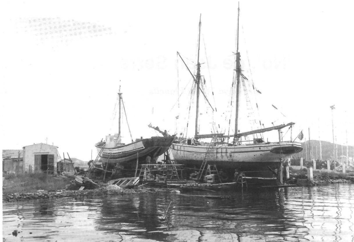
Anys seixanta: aspecte de la drassana vista des de la carretera de Sant Joan.