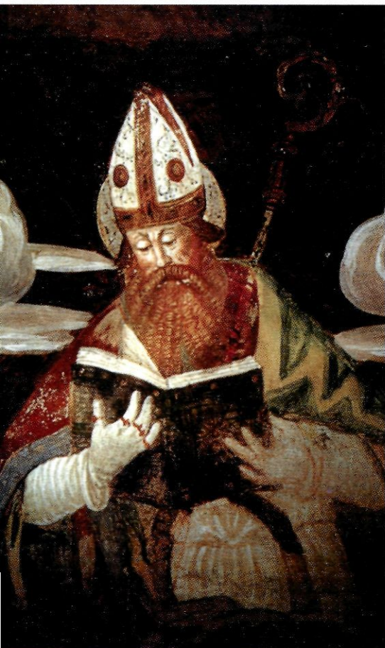
Aurelio Luini i Carlo Urbini "Els doctors de l'Església: sant Agusti". (Verbania-Pallanza, Santa Maria del Camp.)

per les percepcions polimorfes dels sentits. Allí hi són guardades totes les representacions que han captat els nostres sentits i totes les altres dades que hi són dipositades, en la mesura que no les hagi absorbides i soterrades l'oblit... Totes elles les rep, per tornar-les a evocar i a recobrar, quan calgui, el vast habitacle de la memòria dins no sé quins secrets i inefables replecs de la seva natura: totes elles hi entren (les impressions i representacions), cadascuna per la porta que li és reservada, i s'hi arreglaren en ordre. Però no hi entren pas les realitats mateixes, sinó sols les imatges de les coses percebudes, per estar-s'hi a la volença del pensament que les evoca. Tot això passa dins de mi mateix, en l'ingent palau de la meva memòria. És allí, en efecte, que tinc a l'abast el cel i la terra i el mar i totes les impressions que