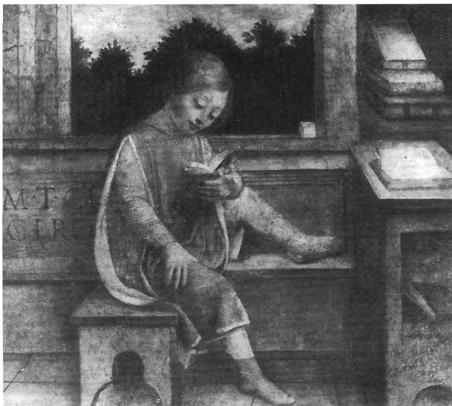
Vincenzo Foppa "Un nen que llegeix Ciceró" (Londres, Col·lecció Wallace.)