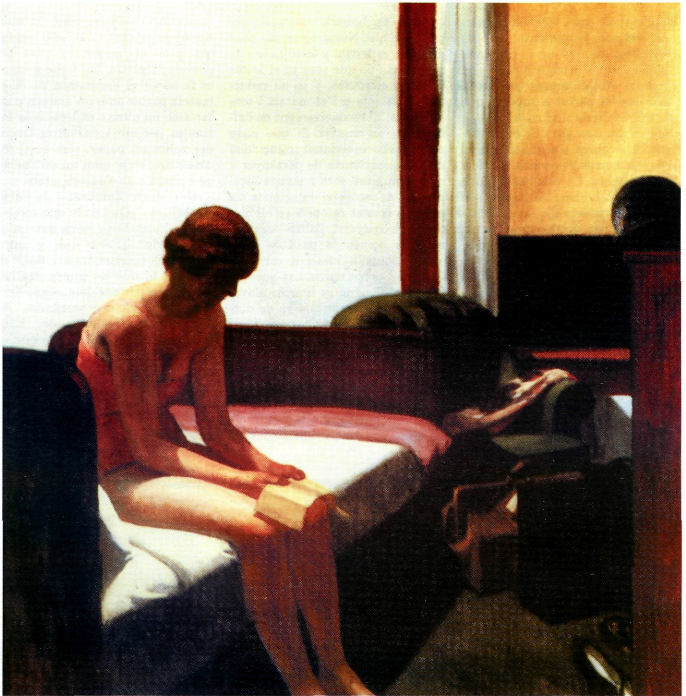
Edward Hopper "Habitació d'hotel". (Lugano, Fundació Thyssen-Bornemisza.)

secreto. Luego ya no es el secreto mismo conocido por él lo que le colma, puesto que necesita comunicarlo. ¿Será esta comunicación? Si es ella, el acto de escribir es sólo medio, y lo escrito el instrumento forjado".