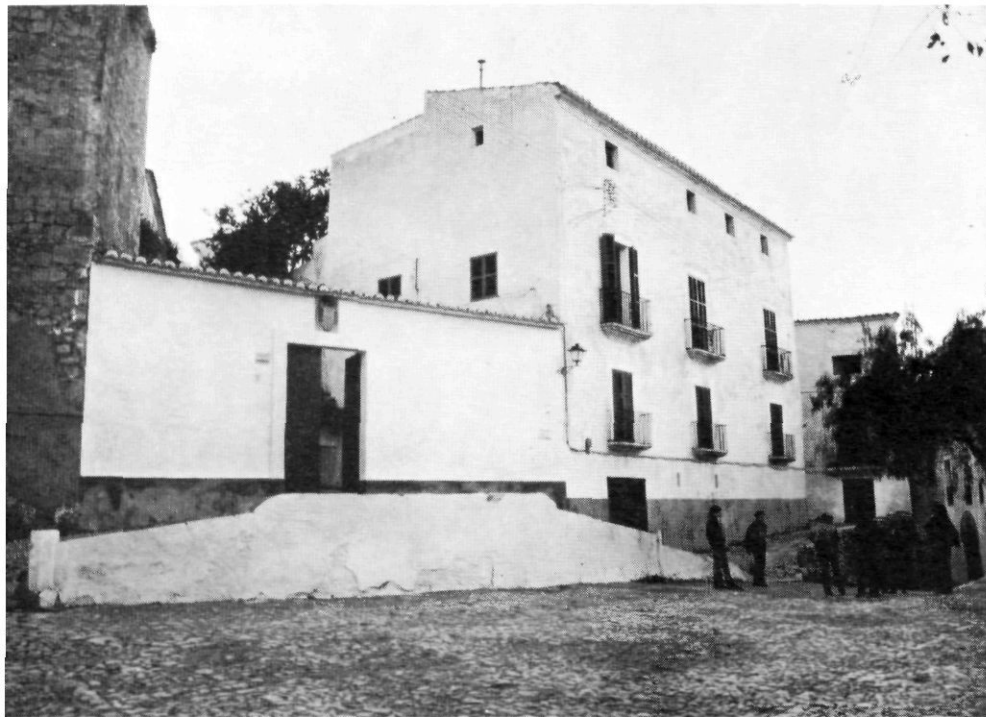
El palau episcopal, popularment conegut per cal bisbe, abans de la remodelació de la plaça de la Catedral.

part nostra procurarem recordar clarament l'abast que ha tengut i té a les nostres illes l'obra que els diferents bisbes han dut a terme.