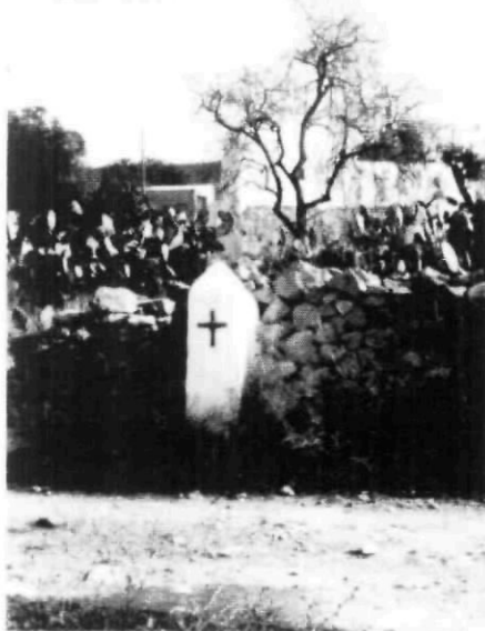
Una estación del vía crucis.

silio Antonio Carrasco añade unas instrucciones concernientes a los matrimonios por procurador , que parecen haber sido más frecuentes de lo que se podría creer. Exige que el representante del novio acredite debidamente su condición "en virtud de poderes legítimos exhibidos en el día tantos... por el notario N." Asimismo, manda que en la partida, después de las palabras "habiéndose entendido antes su mutuo consentimiento", se añada la fórmula: "y hecho la contrayente juramento en forma de no cohabitar antes de ratificarse este matrimonio y oír la misa nupcial", prueba de que las mozas de San Mateo —y sin duda de otras parroquias— no esperaban a que el cura les echase su bendición para yacer con su novio (8-XI-1833).