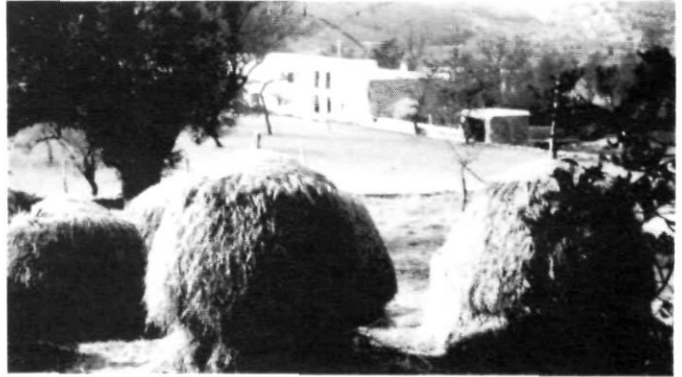
La iglesia de San Mateo (izquierda) vino a acoger el culto religioso inicialmente atendido en Can Cardona (derecha), hoy llamada Ca N'Esperança.

tar fondos, administrar los caudales y dirigir la obra de la fábrica. Pero estas cantidades no siempre bastaron a hacer frente a los gastos. A título de ejemplo, he aquí lo que se recogió el primer año, del 20 de marzo de 1786 al 1.º de junio de 1787: